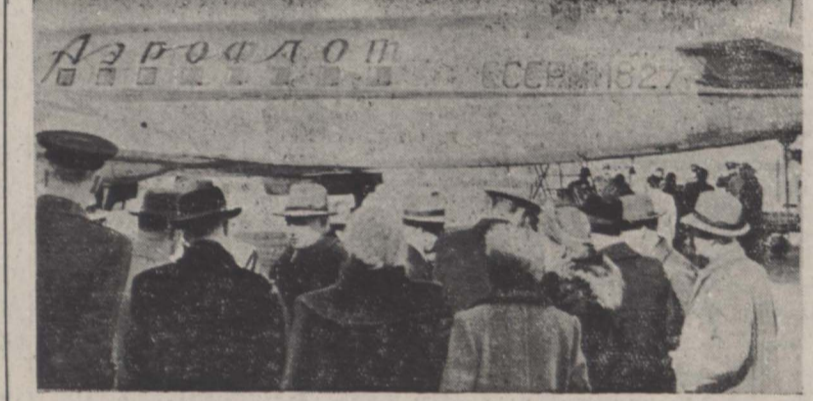
آقای لاورتیتف سفیر کبیر شوروی قبل از شوار شدن بهواییای دو موتورده مخصوصی که از مسکو برای انتقال وی در فرودگاه مهر آباد بر زمین نشسته بود با مشتایک کنند نان خدا حافظی کرد بقیه در صفحه چهارم

برای عضویت هیئتی جهت تعیین بهترین نویسنده سال عده ای از استادان دانشگاه تهران در بارشاهنشاه معرفی شده اند در اول سال آینده یکصد هزار ریال جایزه به نقر از بهترین نویسندگان داده میشود امروز اطلاع حاصل شد که از طرف دانشگاه تهران عده ای از استادان دانشگاه تهران برای عضویت هیئت مخصوص تعیین بهترین نویسنده سال به وزارت دربار شاهنشاهی معرفی شده اند تا از این آنان بفرمان اعلیحضرت هایوتی چند نفر انتخاب گردند قبلا در این باره از طرف وزارت دربار طی نامه ای از دانشگاه تهران تقاضا شده بود عده ای از استادان را معرفی نمایند بطوریکه خوانندگان اطلاع دارند چندی قبل وزارت دربار ضمن اعلامی ای اطلاع داد که بنا بر شاهنشاهی به نقر از بهترین نویسندگان مترجمین سال پنجاه و هشتی مرتب از استادان دانشگاه تهران جمعا مبلغ یکصد هزار ریال جایزه داده خواهند شد هیئت مزبور بزودی پس از تعیین اعضای آن شروع بکار خواهد کرد و تا قبل از پایان سال سه نفر از بهترین نویسندگان یا مترجمین را تعیین و معرفی خواهد کرد. باین سه نفر ترتیب پنجاه هزار ریال، سیصد هزار ریال و دویست هزار ریال در اول سال آینده جایزه داده خواهد شد