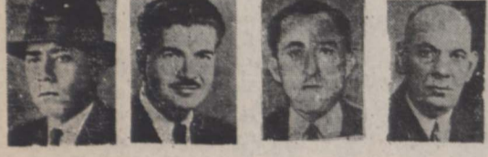
اورنگ، مسعودی، ایسا سلا، عاملی

وزارت کشور ضمن یخنامه ای بفرمانداران تذکر داد: انتخابات مجلسین باید با استقفاه از حداقل مهلت قانونی صورت گیرد فرمانداران میتوانند انتخابات مجلسین را توأم با یکدیگر انجام دهند همین جلسه انجمن نظارت مرکزی انتخابات سما بعد از ظهر امروز تشکیل میشود. در این جلسه نسبت به تشکیل انجمنهای فرعی و تعیین اعضای شعب اقدام خواهد شد