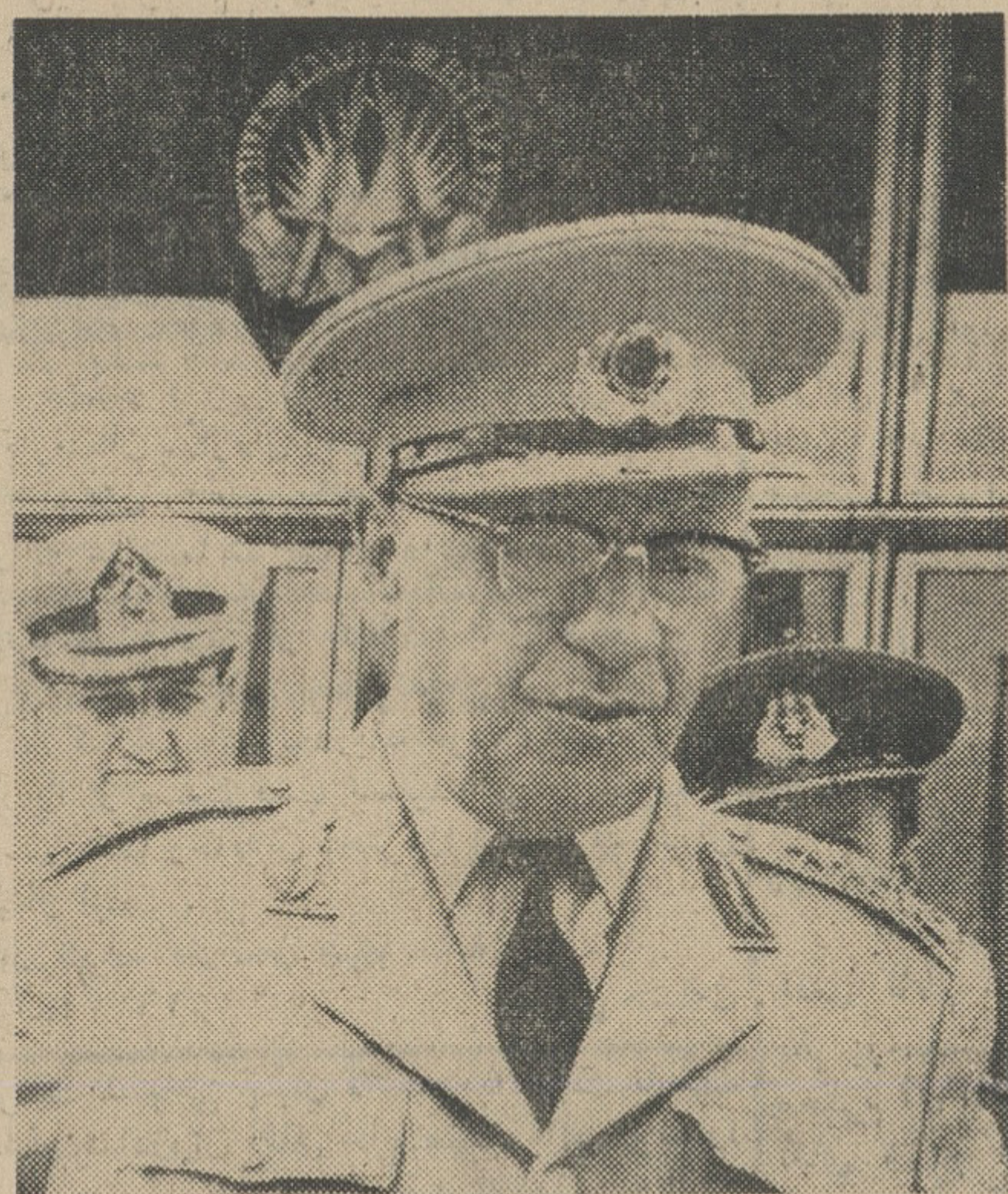
ژنرال جودت سونای رئیس ستاد ارتش ترکیه دیروز برای مذاکره با ژنرال لنینتزر فرمانده کل نیروهای ناتو وارد پاریس شد. این عکس ژنرال سونای را بعد از ملاقات با وی نشان میدهد.

● جنهای ترکیه برای پنجمین روز پراز قبرس به پرواز در آمدند و عکس های اکتشافی برداشتند ● یونانیان قبرس از تخلیه دهات ترک نشین خودداری می کنند ● در غرب گفته شد وضع قبرس به ثبات رسیده است در صفحات ۳ و ۴