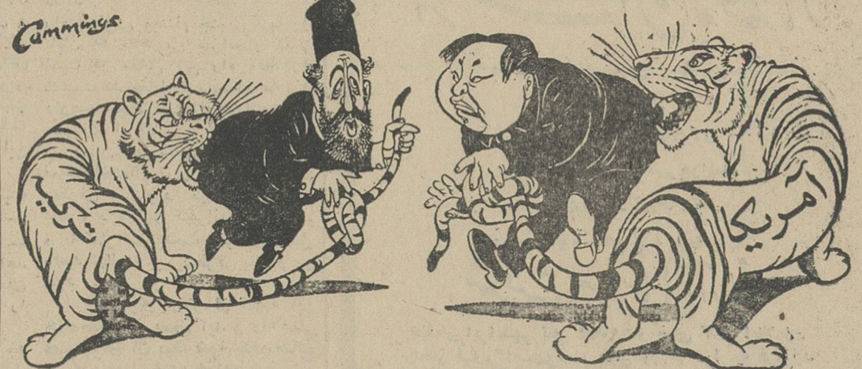
ماکاریوس: رفیق ماوتسه تونک لیدی ببری که بادمش بازی میکردیم کاغذی نبود

و ترکیه و انگلستان امضای قراردادی درباره تضمین استقلال این کشور بود هدف امضاء کنندگان این قرارداد حفظ استقلال و امنیت جمهوری جدید از یکطرف و حفاظت قانون اساسی آن از طرف دیگر بود . در قانون اساسی قبرس سعی شده است که بین حقوق و منافع قانونی جامعه ترک و یونانی یک نوع تعادل ایجاد شود . موجب این قرارداد انگلستان ، ترکیه و یونان در این جزیره مسئولیت مشترک دارند . به همین جهت هنگامی که در سپتامبر ۱۹۶۳ بار دیگر بین دو جامعه ترک و یونانی قبرس زدو خورد آغاز شد ، دولت انگلستان اینکار عمل را در دست گرفت . کنفرانسی از نمایندگان سه دولت در لندن تشکیل داد و ضمناً از دبیر کل سازمان ملل متحد درخواست شد نمایندهای بعنوان ناظر بقریب بفرستد . کنفرانس لندن که مأمور بود دو جامعه ترک و یونانی را با هم آشتی دهد در کار خود توفیق نیافت و از آن پس اوضاع جزیره به تدریج رو به وخامت گذاشت . دولت انگلستان در ژانویه ۱۹۶۴ ناچار شد از کشور های دیگر بخواهد که در حفظ صلح قبرس شرکت کنند پیشنهاد انگلیس که با همکاری دولت امریکا تهیه شده بود در ۳ فوریه گذشته باسقف ماکاریوس تسلیم گردید ولی رئیس جمهوری قبرس این پیشنهاد را رد کرد . دولت انگلستان یکی از این پیشنهاد ها که بازمه با همکاری امریکا تهیه شده بود استقرار نیروهای سازمان ملل متحد در جزیره قبرس و تعیین یکتفریحیاتی از جانب این پیشنهاد ها بازمه از جانب اسقف ماکاریوس رد شد و در این هنگام اوضاع در جزیره قبرس بیوسته رو بوخامت میرفت و سرانجام رئیس جمهوری قبرس با استقرار نیرو های ملل متحد در جزیره موافقت کرد .