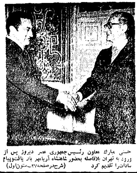
حسین مبارک معاون رئیس جمهوری عمر دیروز پس از ورود به تهران بلافاصله بحضور شاهنشاه آریابهر بار یافت و پیام سادات را تقدیم کرد (شرح در صفحه ۲۷ - ستون اول)

در مجلس امروز گفته شد: چرا شیوع وبا را که ۷ نفر تلفات داشت از مردم پنهان کردید؟ هم بیمار و هم پزشک از وضع بیمه و درمان ناراضی اند ۱۰ هزار تومان عوارض برای گذر نامه تقاضا شد وزیر بهداشتی و بهزیستی: هیچ بیماری امروز پشت در بیمارستان نمی ماند. صفحه ۲ در جلسه امروز مجلس: ۱۰ هزار تومان عوارض برای گذر نامه تقاضا شد صفحه ۲ - ستون هشتم