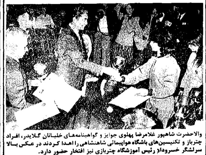
والاحضرت شاهپور خلارضا پهلوی جویز و گواهینامه های خلبانان گلابی، افراد چترناز و تکنیکس های باشگاه هواپیمائی شاهنشاهی را امضا کردند در عکس بالا سرلشکر خسرو داد رئیس آموزشگاه چترنازی نیز افتخار حضور دارد.

در این جلسه چند تن از نمایندگان کارگران در مورد نارسائی های خدمات درمانی سخن گفتند. آنها یادآور شدند باینکه هر کارگری ماهانه ۳۰ درصد حق بیمه پرداخت میکند و در آمد صندوق تأمین اجتماعی از این راه اسما به حدود هفت میلیارد تومان رسیده است، با این وصف کارگران از امکانات درمانی بهره کمی می برند.