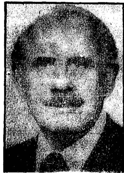
نور محمد ترک، رئیس جمهوری جدید افغانستان - «بهبود کشور پیمان نظامی نمی‌بینیم.»