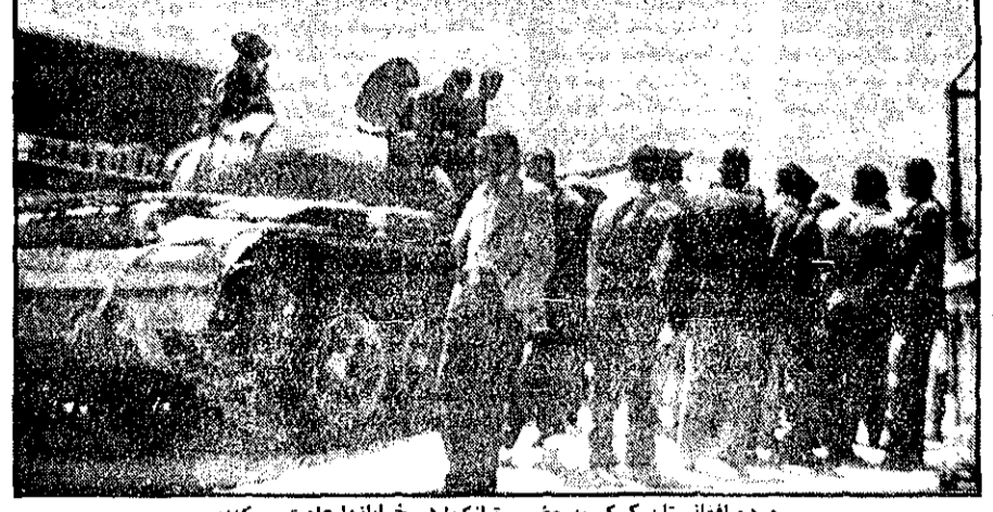
مردم افغانستان کم کم به حضور تانکها در خیابانها عادت می کنند

نور محمد تره کی، که علاوه بر نخست وزیری، رئیس شورای انقلاب و دبیر کل حزب حاکم دموکراتیک خلق نیز هست، در کنفرانسی مطبوعاتی اعلام کرد: «ما برخلاف آنچه بعضیها می گویند، هر هیچ کسی نیستیم. ما امور خود را بر حسب شرایط و اوضاع کشورمان پیش خواهیم برد» تره کی، که نخستین کنفرانس مطبوعاتی خود را از هنگام بدست گرفتن اوضاع افغانستان بعد از کودتای دو هفته قبل تشکیل داده بود، گفت در جریان زود خودرودهای دو روز دوران کودتا فقط ۷۳ نفر کشته شدند. در چنانچه در تظاهرات و کتوهای امپریالیستی گفته می شود هزاران نفر، وی از نام برده و کتوهای امپریالیستی خوداری کرد. وی گفت این تعداد و کشتگان چه از ما و چه از مستمران را شامل می شود. خبرگزاریها و مطبوعات غرب قبلاً از قول منابع موثق افغانی و خارجی نقل کرده بودند که در کودتای افغانستان بین ۳۲۰۰ تا ۱۰ هزار نفر کشته شدند. تره کی گفت محمد داود رئیس جمهوری و اعضای خانواده اش مقاومت کردند و کشته شدند. وی گفت افغانستان، که کشوری ۱۲ میلیون نفری فقیر و در مراحل ابتدایی رشد است، از الگوی هیچ کشور دیگری پیروی نخواهد کرد بلکه راه خود را خواهد رفت. وی اعلام کرد که افغانستان هرگز در پیمان نظامی با کشورهای دیگر شرکت نخواهد کرد.