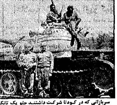
سربازانی که در کودتا شرکت داشتند جلو یک تانک عکس یادگاری گرفته اند

بکینگ - روزنامه - روابط بین الملل - چین و عربستان سعودی در حال نزدیک شدن هستند. این دو کشور در زمینه های اقتصادی و سیاسی همکاری های فزاینده ای دارند. بکینگ گفت که این دو کشور، منافع ملی خود را به خطر انداخته است.