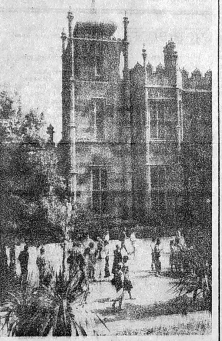
Алушка. Воронцовський палац-музей.