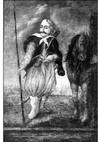
“Портрет сподвижника Івана Гонті, гайдамацького ватажка Івана Бондаренка”. З фондів національного заповідника “Хортиця”.