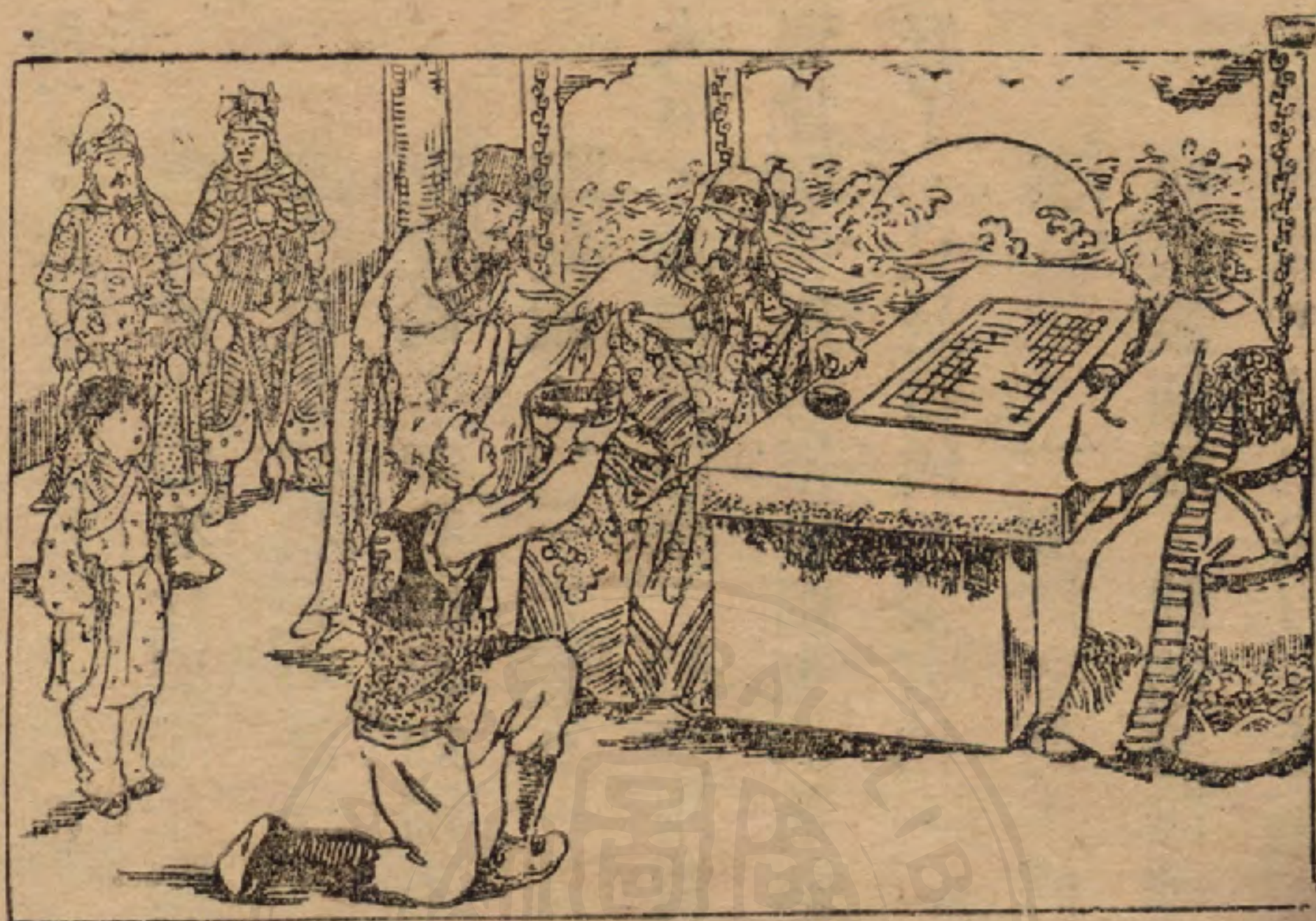
華 陀 替 雲 長 醫 手 臂