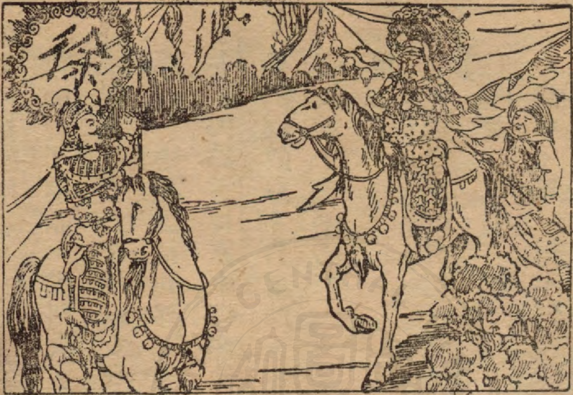
徐晃是雲長的老朋友