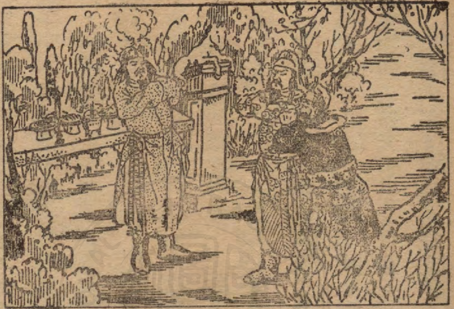
雲長同張飛拜玄德做哥哥

雙。他們本是販馬的。他們看見玄德雲長很有志氣，便給了他們很多金錢，所以玄德雲長們的聲勢，更是浩大了。