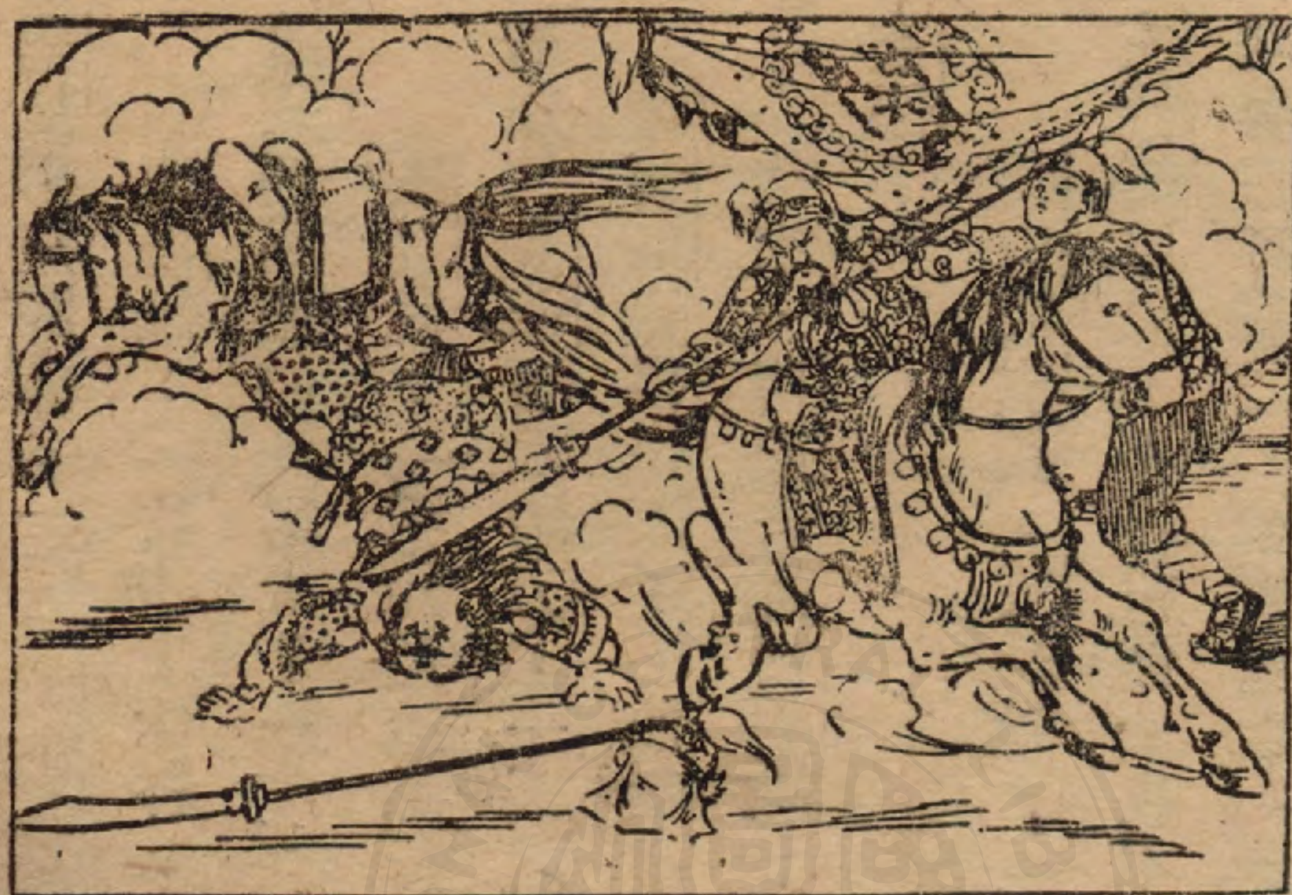
手起刀落斬顏良的頭