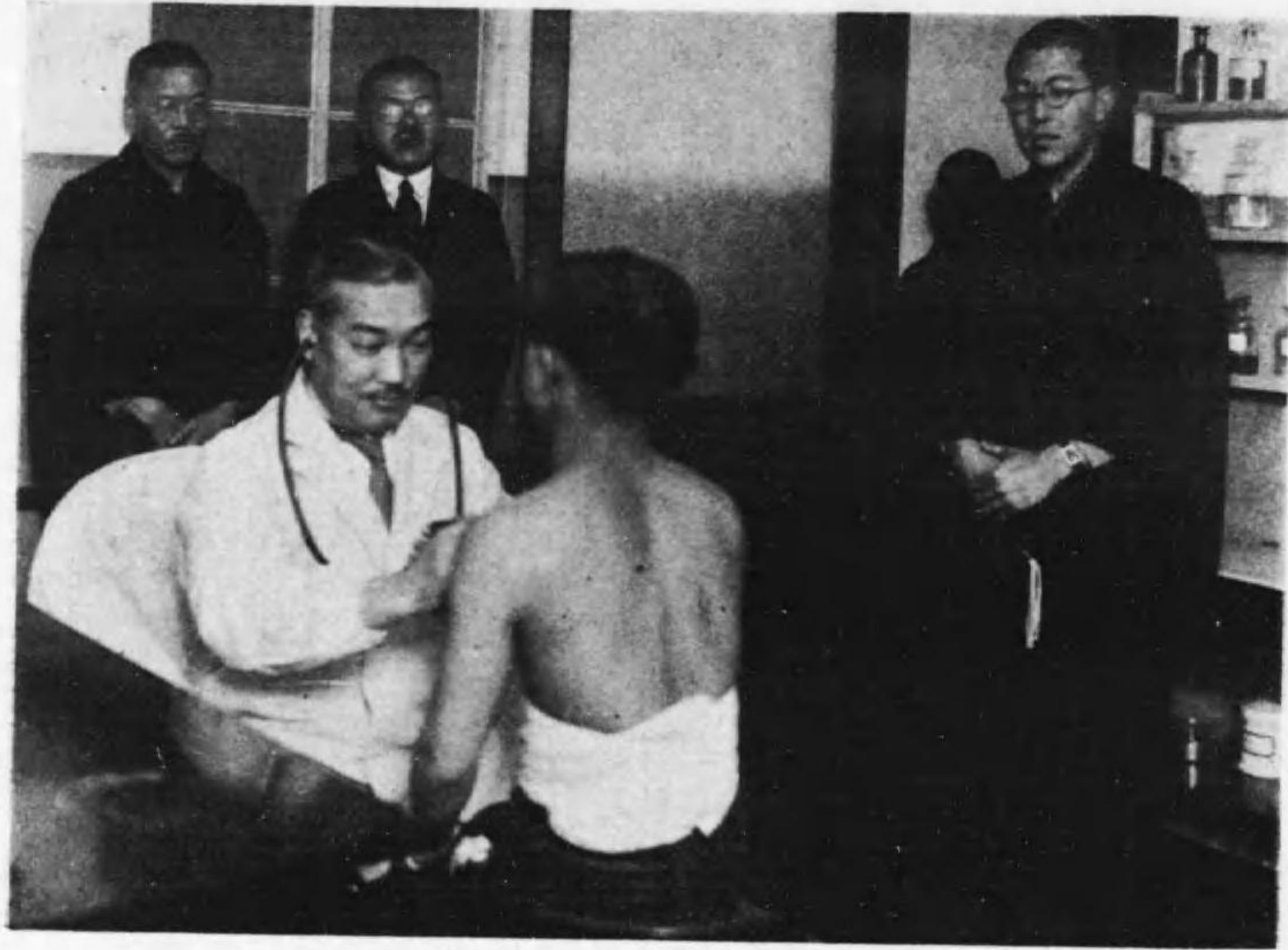
大法主下院へ奉つて 本願寺北御堂診療所第二診察室