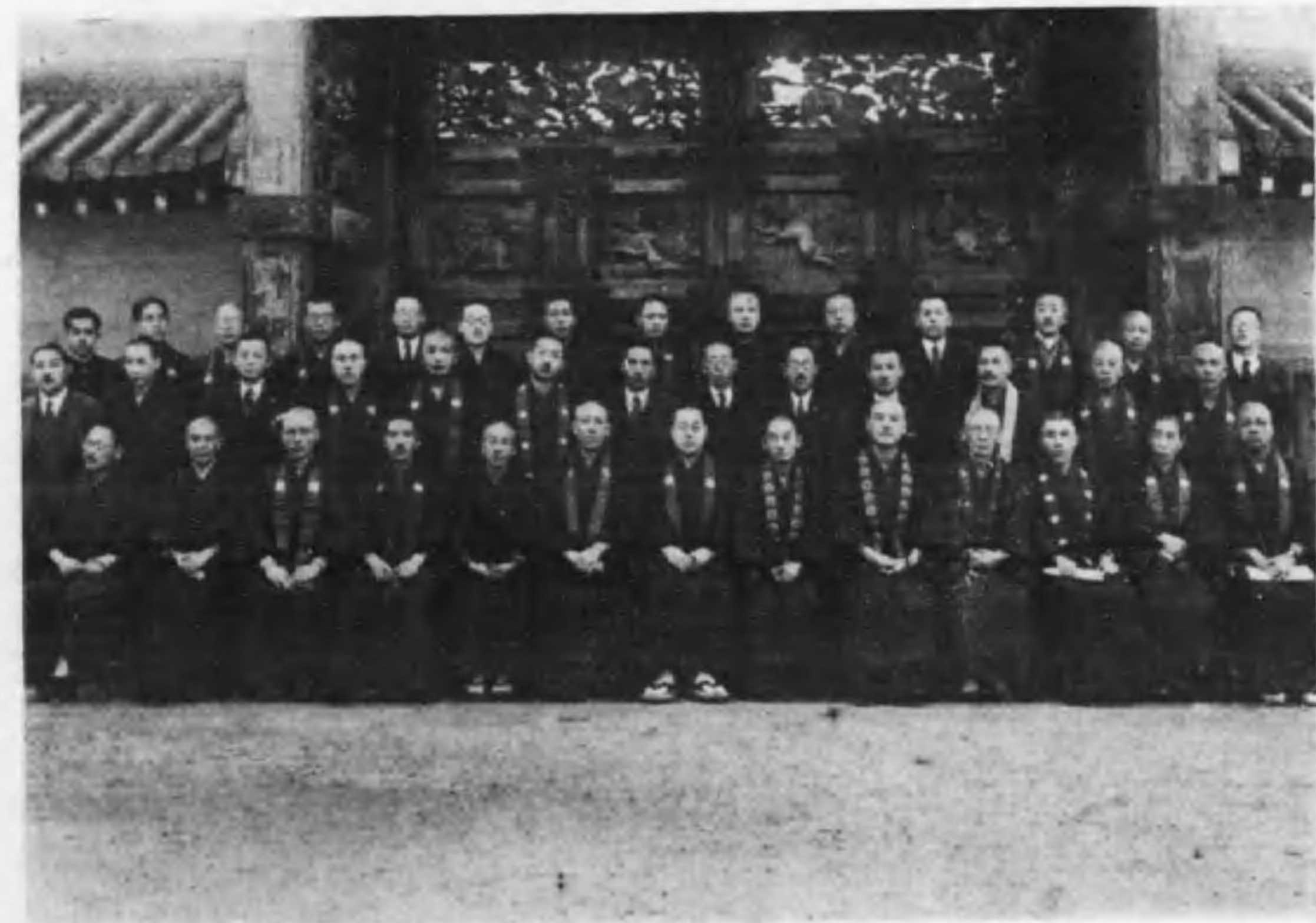
本願寺一如會第六期地方委員