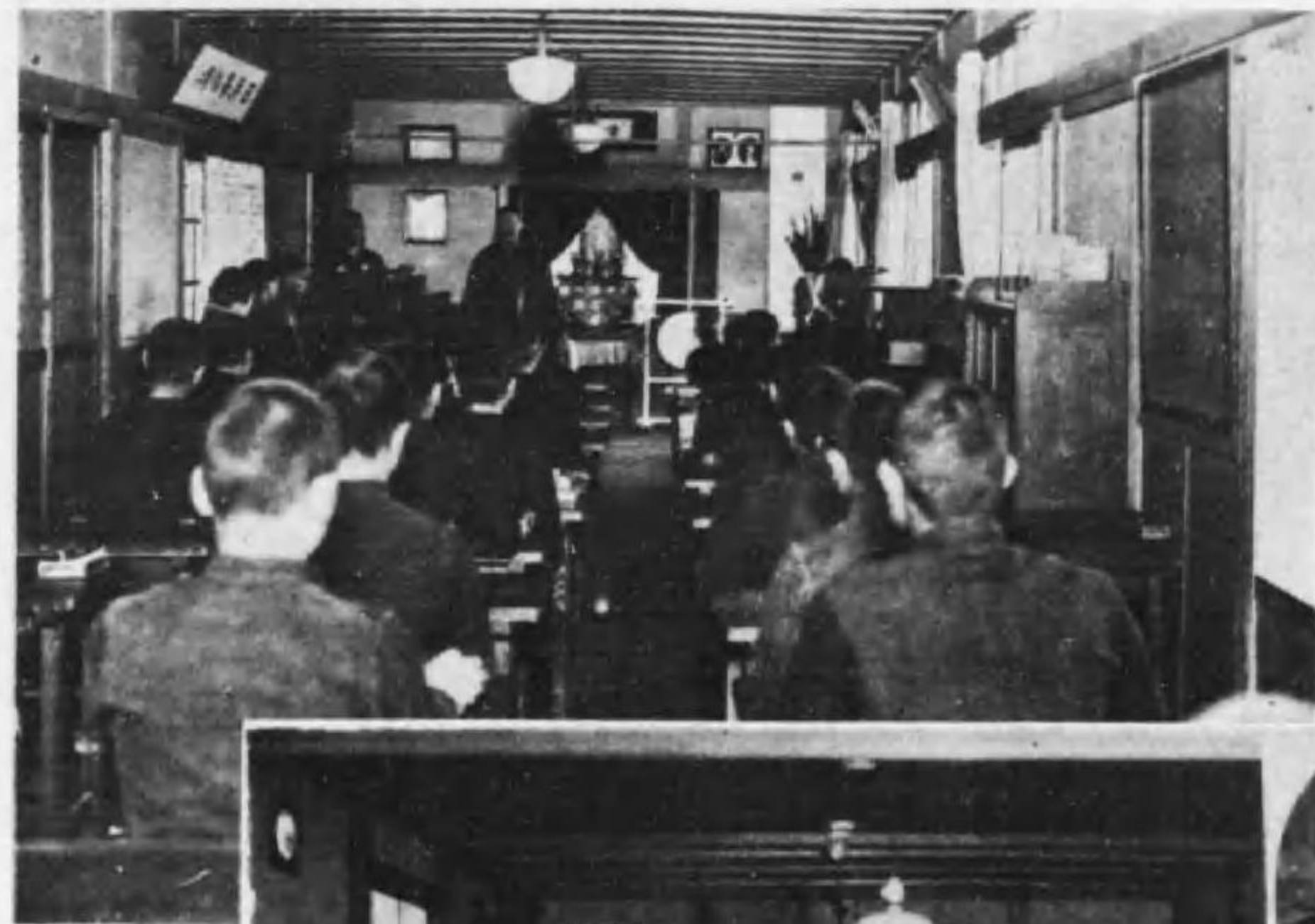
本願寺常照園講堂