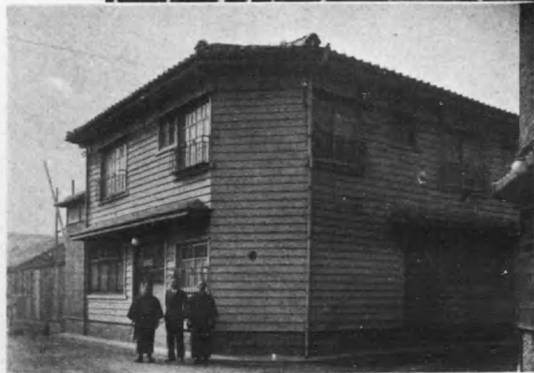
本願寺成功館全景