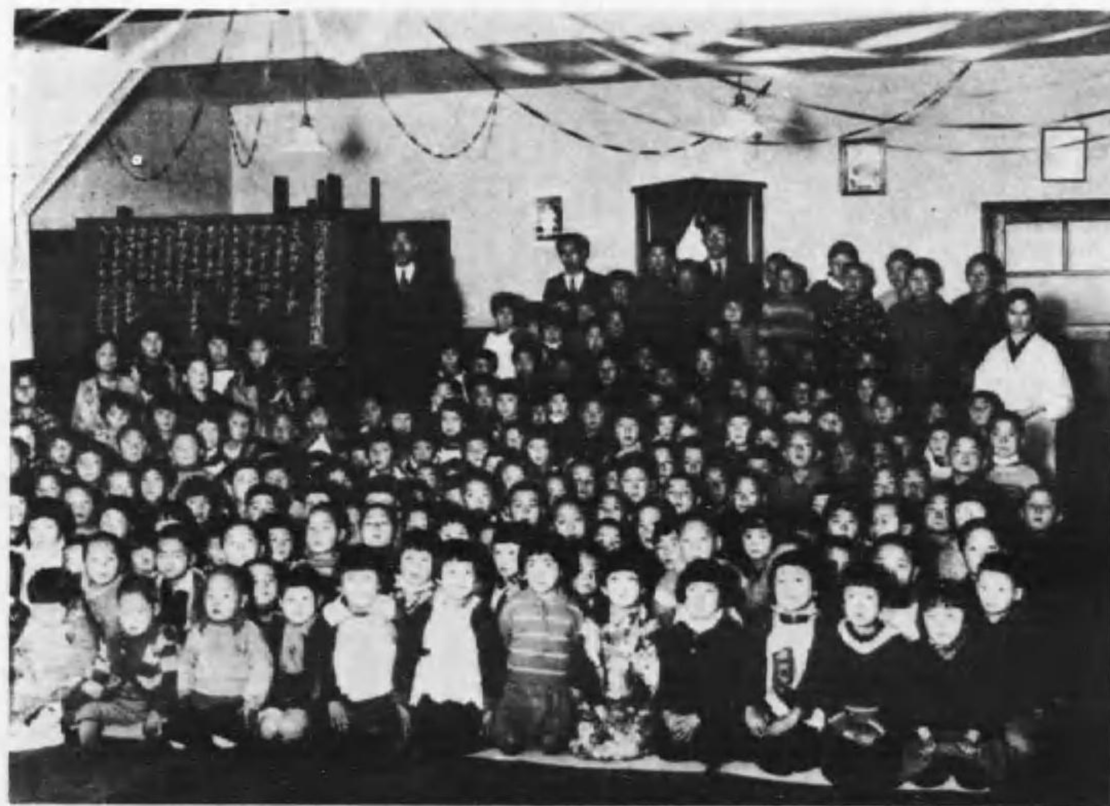
深川佛教會歲末兒童保護園