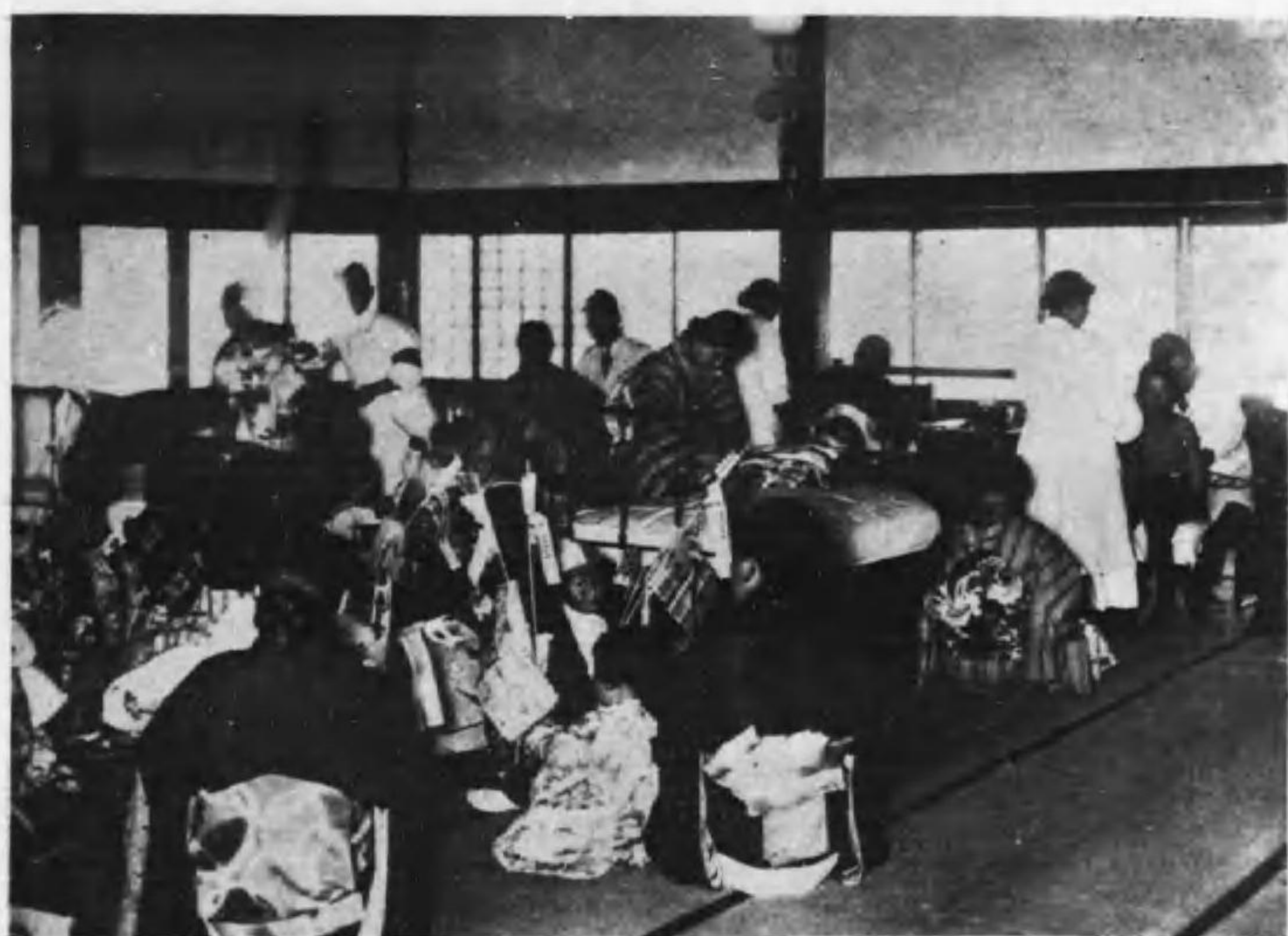
大津長等保育園にて