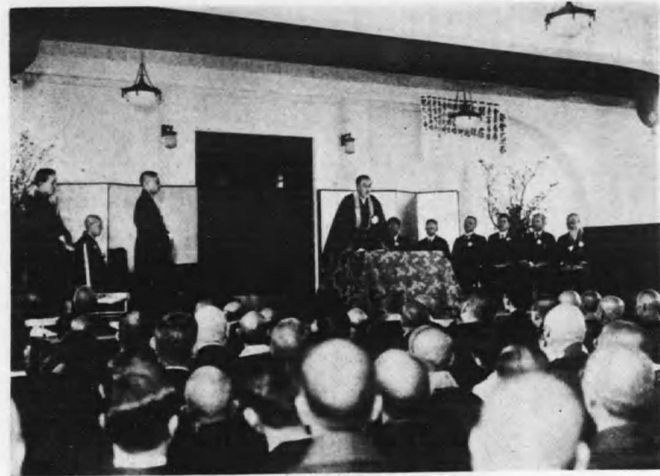
本願寺派社會事業協會發會式