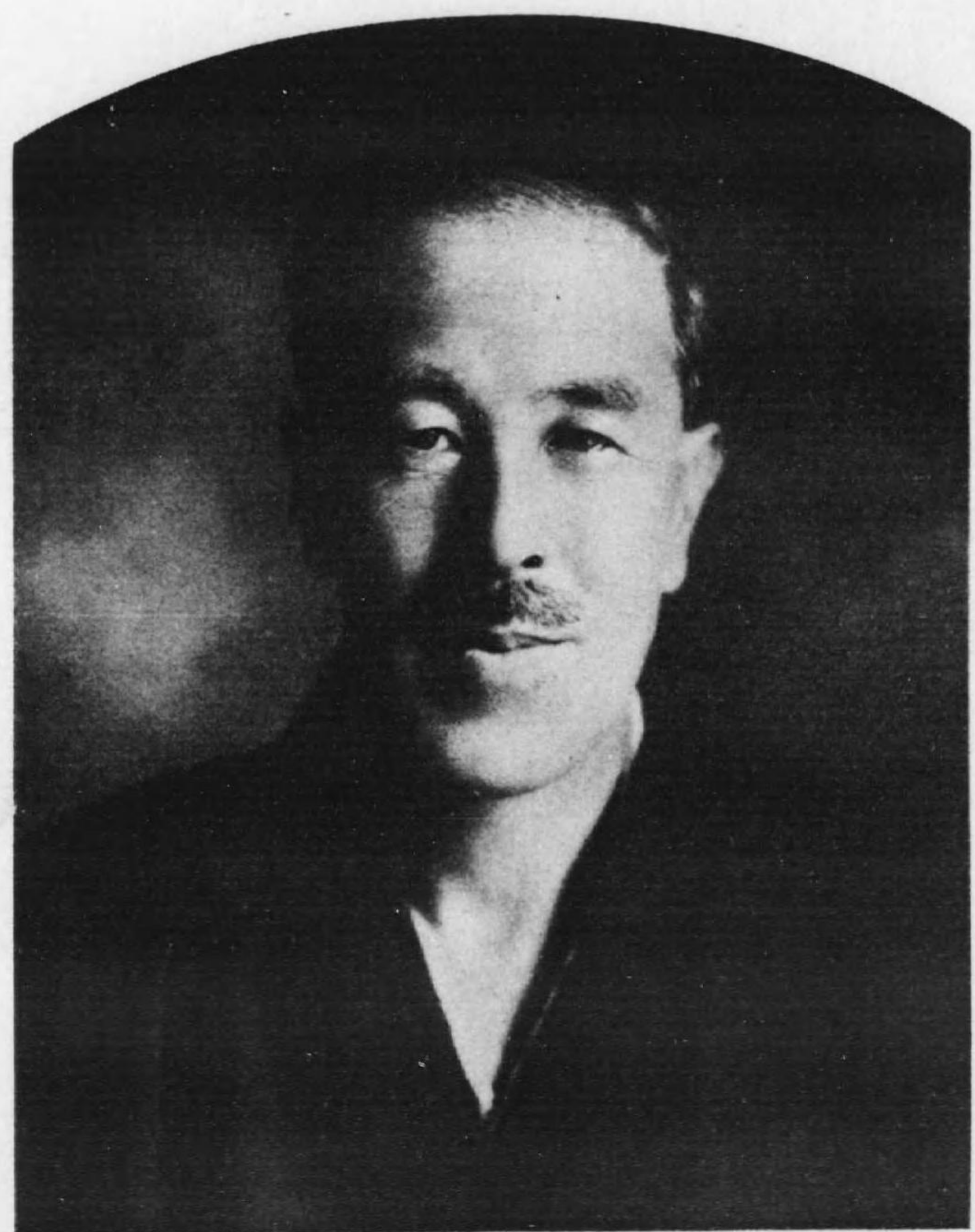
蘇 隸 大谷光圀 不