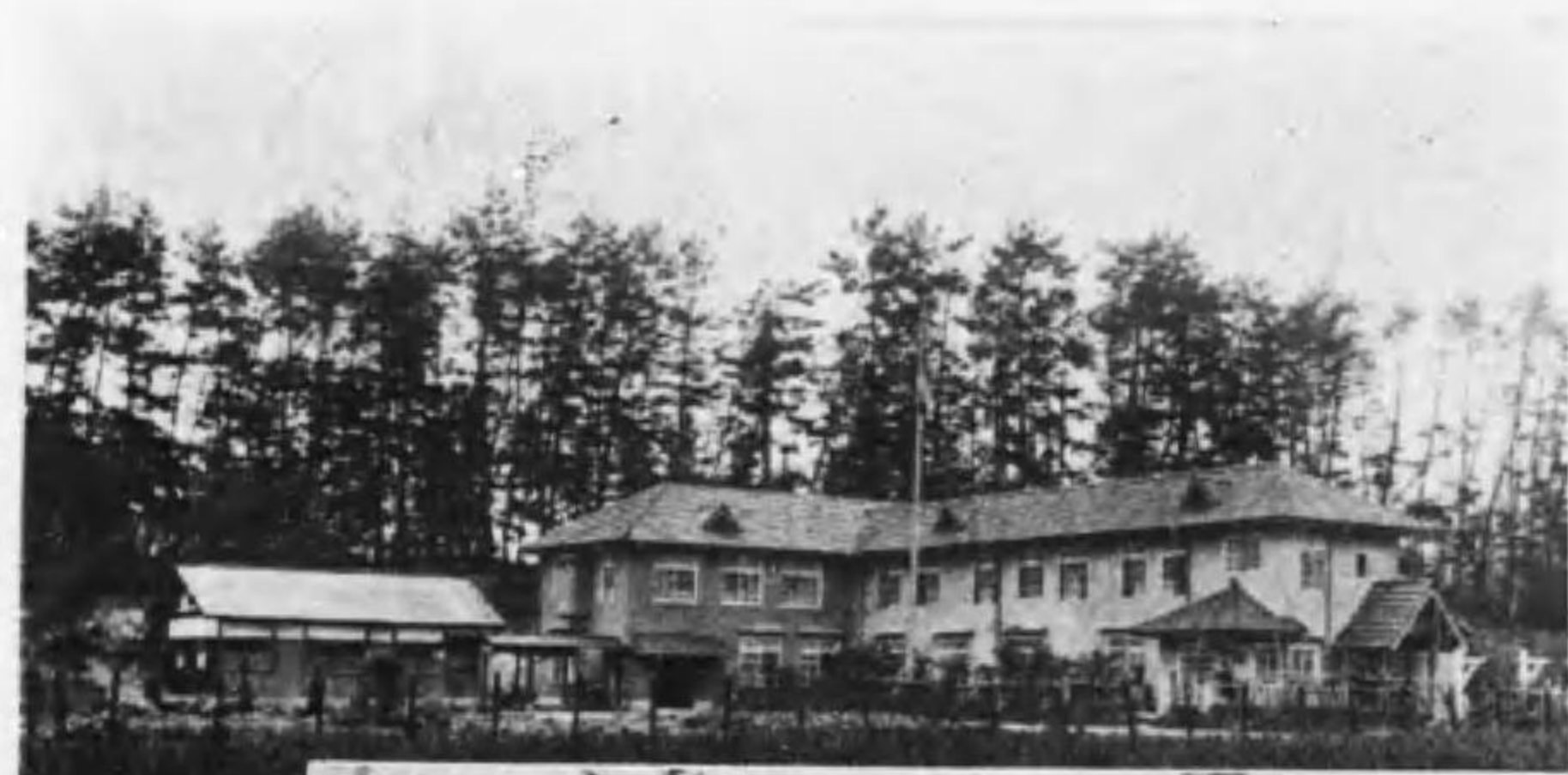
本願寺常照園全景