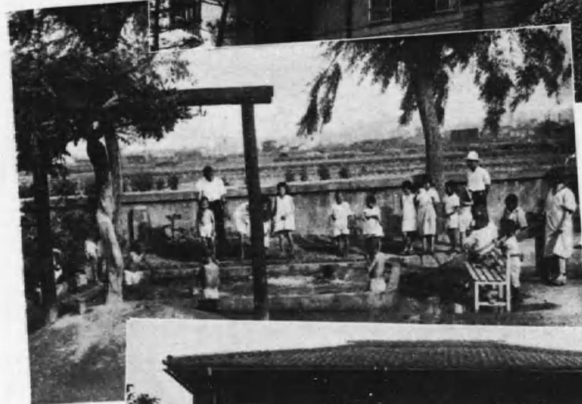
廣島育兒院 保育實況