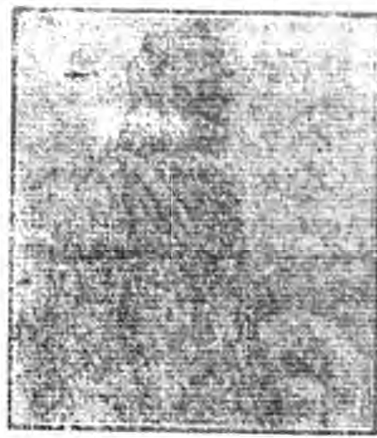
Suetan Ibn Soud The King of Neged

涅幾特王以文沙烏德者。華哈布派之領袖也。且其數世以前之祖先。即爲回教復古運動之健將。故無論何人。莫不認該派深得回教精神之真髓者也。目下華哈布派以及亞刺比亞回教徒。必崇拜彼爲穆罕默德之化身而再降於世者。自新興土耳其凱末爾帕夏放逐其皇帝及回教主之愛馮底後。則平生虎視眈眈之漢志王胡塞因父子。甘受英國之愚。爲其傀儡。抱統一大亞刺比亞之夢想。而宣言即新回教主之位。是故素惡英國對亞刺比亞政策之涅幾特王以文沙烏德。藉擁護回教之法座及聖地。爲名遂擊退胡塞因父子。今則號令一出。立即可得三十萬騎兵之動員。其威勢之雄厚。事實上已爲全亞刺比亞之霸者矣。以文沙烏德今年方爲四十五六之壯年。其剛毅勇敢之氣。固由其乃父（涅幾特首都里亞特之首長）愛美兒相傳而來。然其好行俠義。而有大人長者之風者。則多由華哈布派之信仰。有以使之然也。蓋所謂華哈布之真諦。即因慨見我回教各派漸墮落於偶像崇拜之一種形式宗教。乃極力主張原始回教之實現。而爲殉教之行動者也。其實以文沙烏德之初願。不過僅爲涅幾特王國之再建而已。今則一進而腐心於大同教主義之實現。觀彼近十數年所取之態度。即爲藉威脅土耳其以補救英國對亞刺比亞之陰險政策。況今更有放逐僞回教主胡塞因。且盡棄其宿怨與土耳其。重修舊好而同盟。末兒帕夏互相策劃之傳聞者耶。然能護守吾回教聖地之如以文沙烏德者。實古今不可多見之回教健兒也。