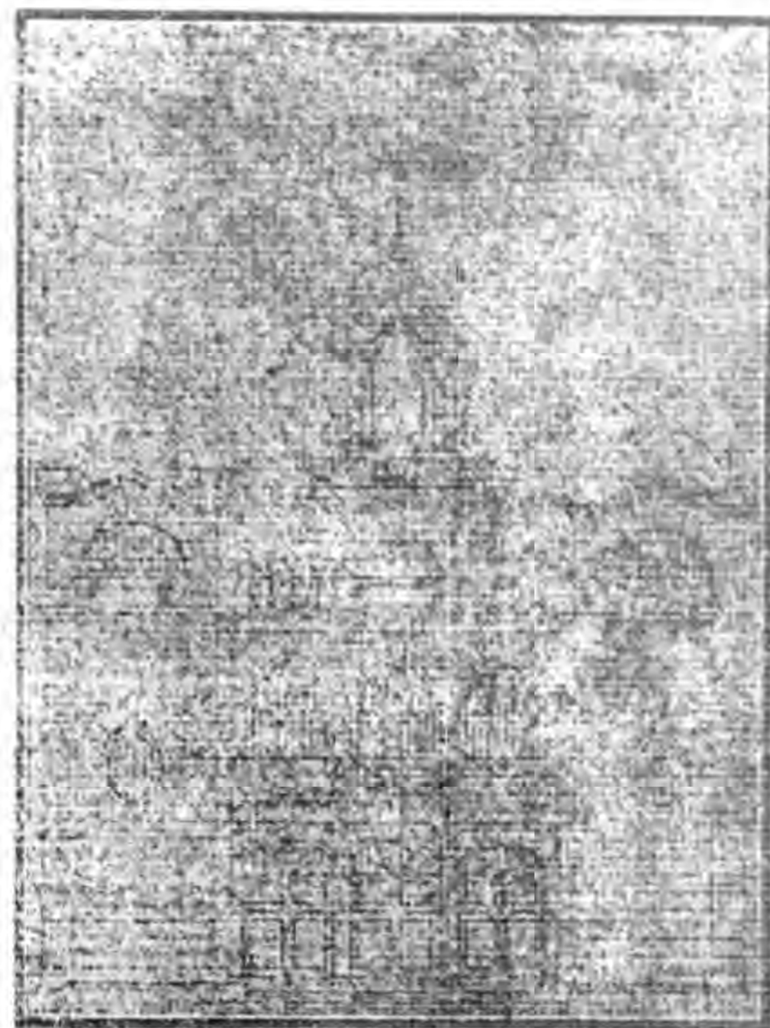
The Desin of the new mosque to be built at Simen, Shanghai.

上海金子雲先生之熱心教務。早爲吾人所欽佩。無待贅述。先生因鑑上海爲工商業之中心地。且吾回民同胞。年年增多。故於民國六。遂竟以私產一萬二千二百元。購得老西門內潘某住宅一院。旋即改修清真寺。即今日之上海清真西寺也。後又得蔣星階先生個人捐銀三千元。復改造盆湯式水房一幢。繼後因修理一切費用較巨。雖得上海各鄉老勇於捐助。然尙不足。復蒙蔣星階先生更助銀一千元。始克完竣。前廳即作爲國民小學校。由上海北寺轉學而來者。不足百人。目下已達三百矣。不分回漢。一律取錄。學費酌收。貧者全免。但校內一切器具並裝修各費。子雲先生慨然售去上海城內九畝地地方之不動私產。近三千元之巨款。擔任一切云云。熱心公