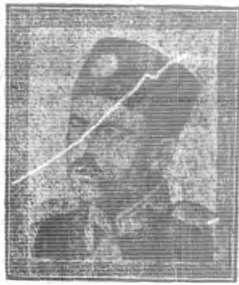
General Kiza-Khan, the Dictator of Persian Republic

一九二四年四月一日。由波斯首府德黑蘭來電。謂波斯首相出論。稱共和政體與回教相抵觸。不許國民談及改建共和問題。否則嚴懲。藉此可窺當時波斯國內之新勢力。對於王制顛覆運動之暗中飛躍之積極進行矣。然其新勢力之中心人物。實為當時之首相兼陸相之李沙汗氏。雖世奉施亞派之波斯回教國。素以政教一致聞名於世。且其教權之專橫。不亞於革命前之土耳其。然卒為世界思潮之大勢所轉移。趨赴共和制度。而為其國中。新勢力之抬頭。夫李沙汗者。不過為波斯哥索古兵團中之一兵卒耳。且其