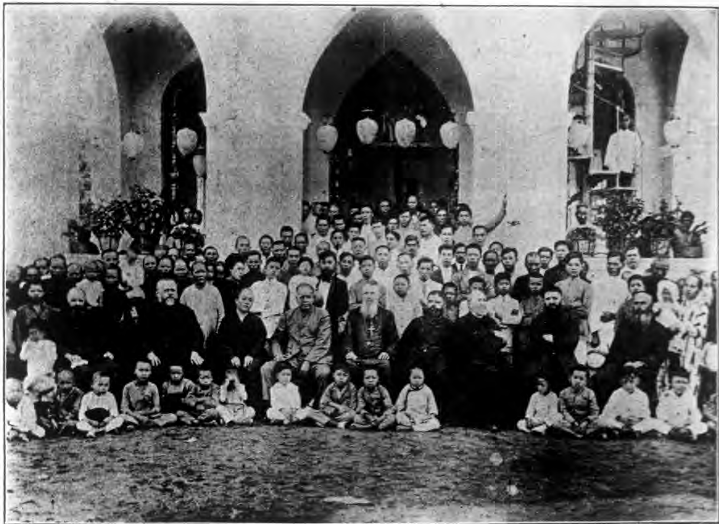
南洋芙蓉島主教司鐸及華僑教友攝影