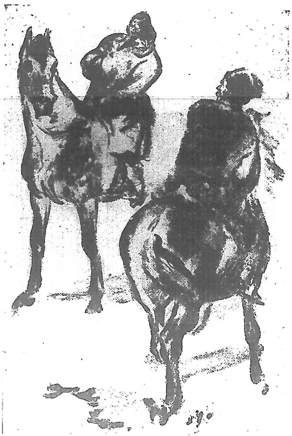
拉古爾洛夫和富農鐵推克