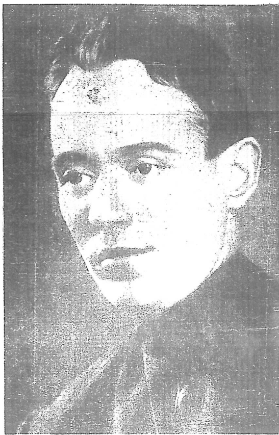
作者 梭羅訶 大像