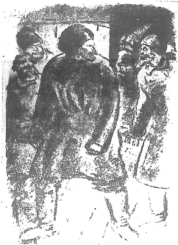
蘇聯富農“參謀本部”的貧農詞普洛夫