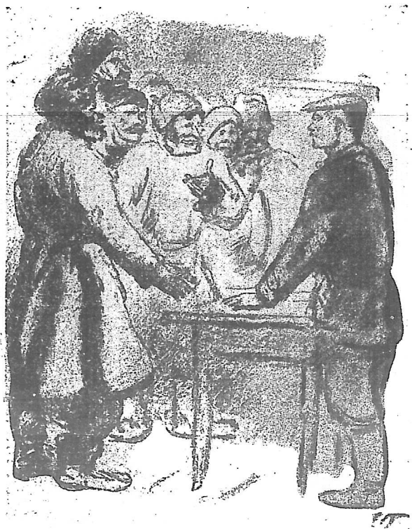
達維多夫 和退出了集體農場的農民