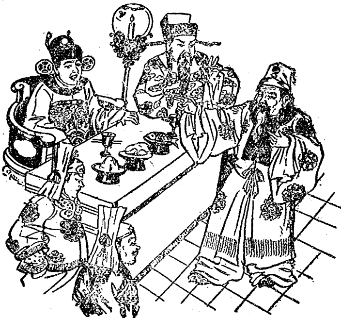
旁邊走出崔長者來，指定劉英大罵。