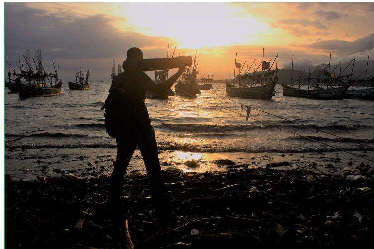
Deux réalités, la terre et la mer la création du jeune trouve un obstacle faut il prendre la voie par la nage immigrer pour poursuivre son rêve?, Simbanemattick, CC BY-SA 4.0