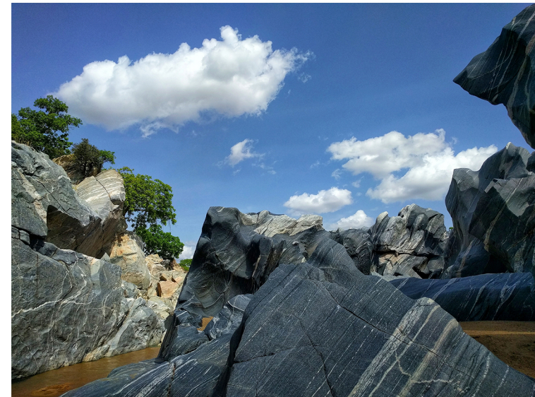
Les Gorges de Kola situé dans le Mayo-Louti à 5,2km de la ville de Guider