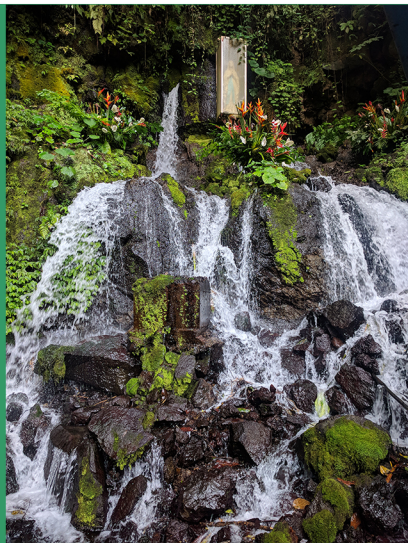
Picture of Our Lady of Grace Grotto showing Holy Maria in the Box, located in Sasse-Buea in the South West Region of Cameroon