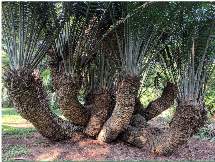
Encephalartos Natalensis plant found in Limbe botanical garden.