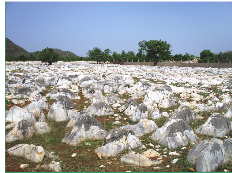
Les gravures rupestres du site archéologique de Bidzar, situées sur la route nationale numéro 1 entre Figuil et Maroua, 2ddanga, CC BY-SA 4.0