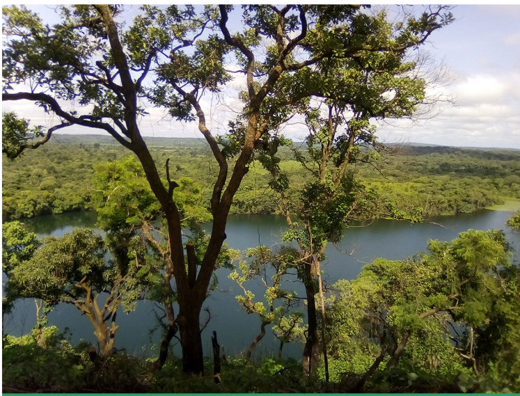
Vue du paysage, Lac de Ngaoundaba, Ngaoundaba, région de l'Adamoua, Cameroun