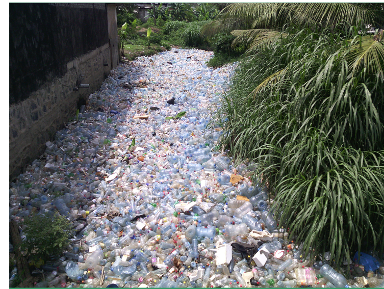
Cette image représente un cours d'eau au quartier Madagascar à Douala avalée par la pollution plastique