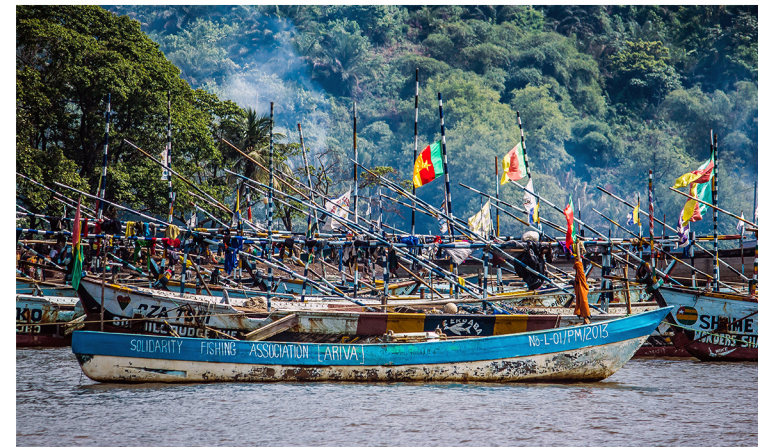
This fishing port is home and source of livelihood to citizens from at least 8 African countries but face a demolition threat because this area has been marked for the future construction of the Limbe sea port, Kekiwiyi, CC BY-SA 4.0