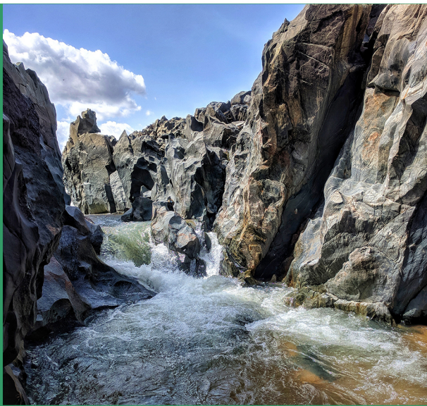
Les Gorges de Kola situé dans le Mayo-Louti à 5,2km de la ville de Guider