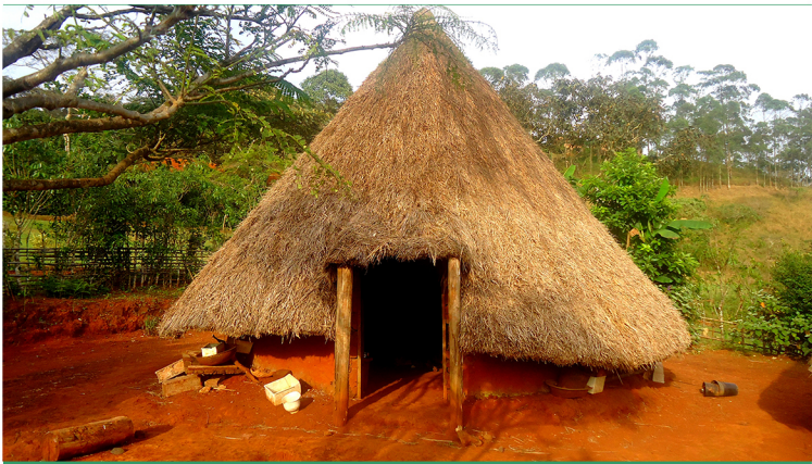
Case de l'aire géographique du Nord, reproduite à la Fondation Jean Félicien Gacha à Bangoulap, dans la région de l'Ouest