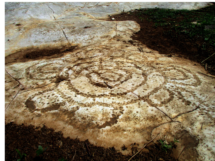
Les gravures rupestres du site archéologique de Bidzar, situées sur la route nationale numéro 1 entre Figuil et Maroua