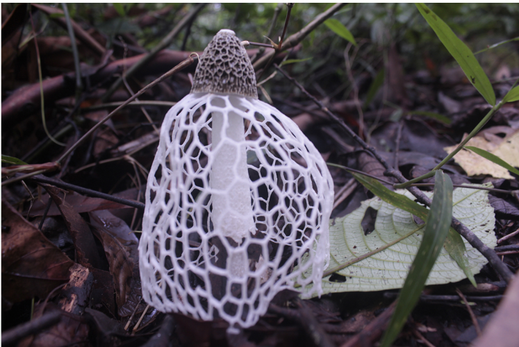
A close shot of the Stinkhorn mushroom growing on the fertile soils of the Mount Cameroon national park