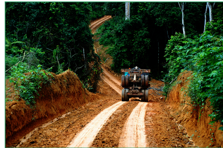
Paysage routier à Makak dans le Nyong Ekellé