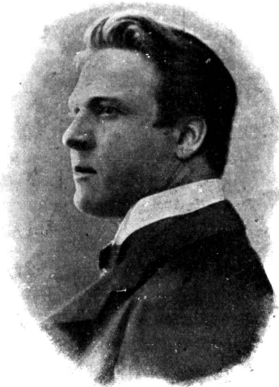
Ф. И. Шаляпинъ.

Списокъ новыхъ спеціальныхъ пластинокъ за Сентябрь 1911 г.