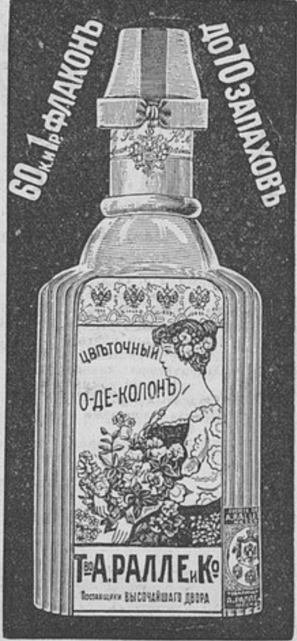
(2548) — 6

по ТАКТИКѢ Составилъ Н. ЛЕВИЦКІЙ. Цѣна 1 р. 50 к., съ перес. 1 р. 75 к. Изданіе В. А. БЕРЕЗОВСКАГО.