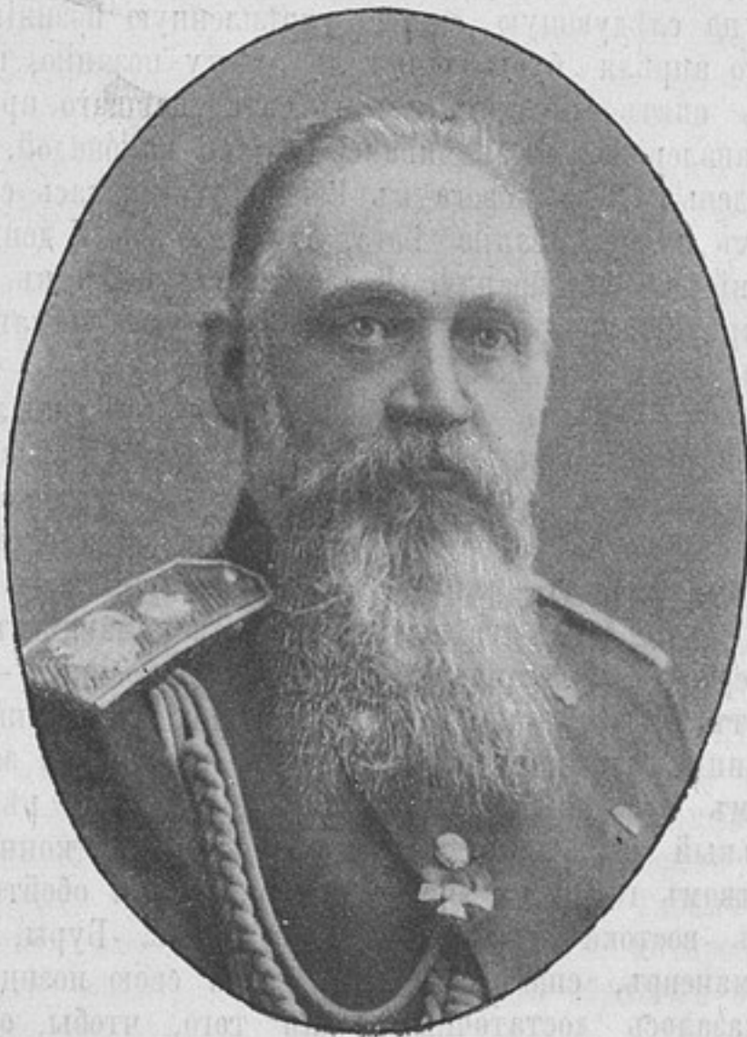
Варшавскій генераль-губернаторъ и командующій войсками Варшавскаго военнаго округа, генераль-адъютантъ, генераль-отъ-кавалеріи

Деньги могутъ быть высланы почтовыми марками, каждая не дороже 50 к. Безденежная подписка не принимается. За перемѣну адреса 28 к. Отдѣльные №№ выслаются за 15 к. Объявленія принимаются по особой расцѣнкѣ, высланной по требованію.