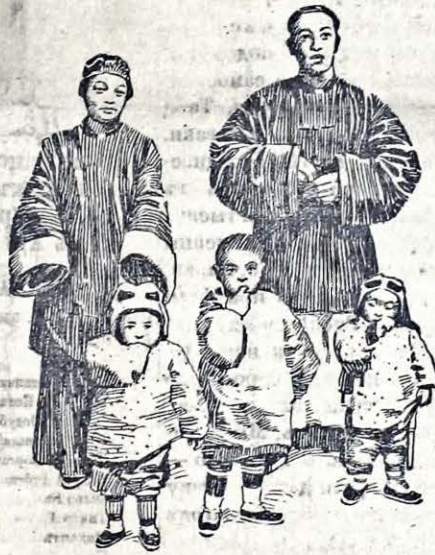
Типы хипскихъ християнъ, котрыхъ (посля твердження часописей) ты саяѣ втратило житє и майно зъ рукъ боксерѣвъ. Подозрѣвали ихъ о прихильность и тайни зносини зъ чужинцами, проте ницєно и мордовано всѣхъ безъ пощады.