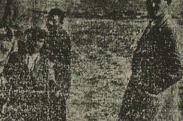
حسین عروس نوبت فیدار پس از ختم ماجرای زنجبان

نایبندگی «دیجست» امریکائی که خواستار فراوان دارد مجله جهان نو خیابان پهلوی در بند دکتر انشار است برای اشتراک مراجعه فرمائید. آ- ۹۵۷۵ ۲-۱