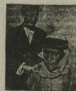
دختر و پسر عروسی در کرسف از پیروی فداان از هم جدا شده اند

در اتاق مضی از ساختن با ذغال اشکال مختلفی کشیده بودند که درین آنها بکرات علامت داس و چکش دیده میشد.