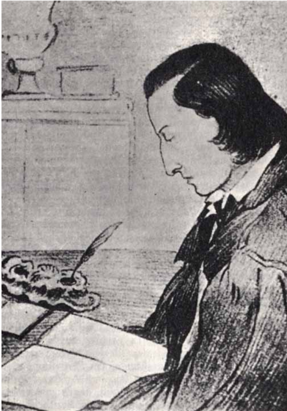
Frédéric Chopin. Tekening van George Sand, ca. 1847