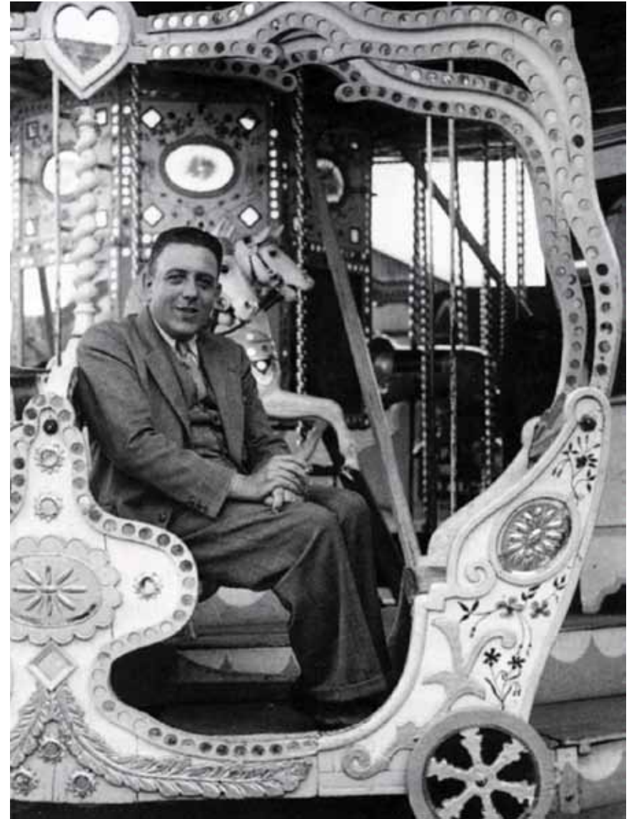
Francis Poulenc

De Sonate voor cello en piano, opus 143 beleefde zijn première op 18 mei 1949 in de Salle Gaveau in Parijs, met Pierre Fournier als cellist en Francis Poulenc zelf achter de piano. Het werk werd ook aan Fournier opgedragen, meer dan waarschijnlijk omdat hij Poulenc geholpen had met de muzikale en technische mogelijkheden van de cello. De kritieken waren echter niet zo lovend. Vaak wordt van Poulenc gezegd dat hij nieuwe melodieën