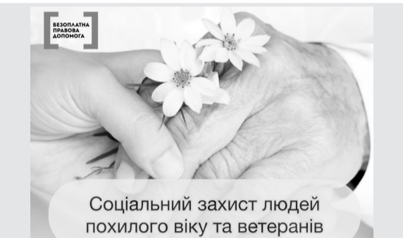
Соціальний захист людей похилого віку та ветеранів