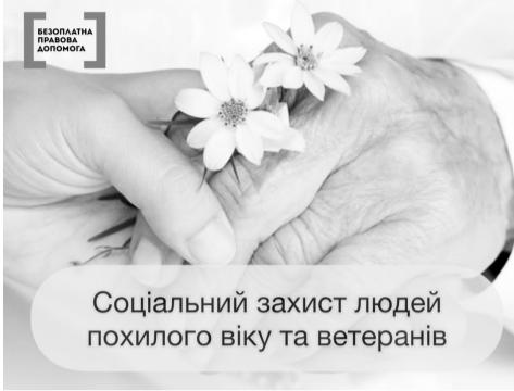
Соціальний захист людей похилого віку та ветеранів

Ветеранам праці видаються посвідчення про право на пільги та нагрудні знаки, порядок виготовлення яких встановлюється