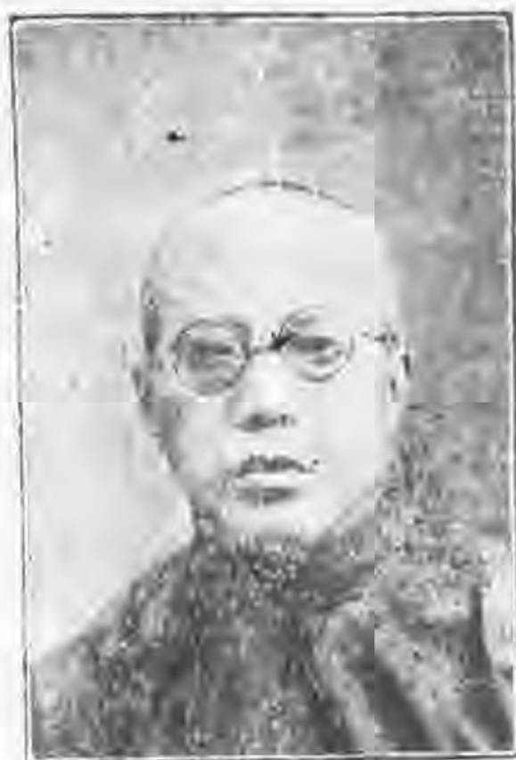
生先渾叔袁理經社書智益江松

部間頗有新興同業。如石寶寨商店，奉節冶雲書館分銷處，均為去年秋季及本屆春季新行創辦。現在內江方面，又有信立商店之開設，已與本館訂立往來，春季書籍，業經配去矣。按四川本館已有重慶成都兩分館，當初次來函商討往來事宜，本館即介紹就近分館接洽。嗣接該號來信，謂距成都重慶兩處，各六七百里，內地交通不便，猶不如來滬為速，盛意難却，故仍允如所請焉。