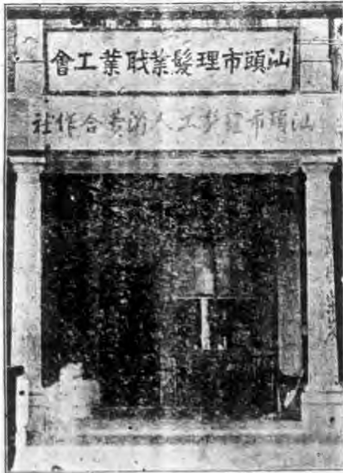
汕頭市理髮工人消費合作社之外部

修整社員日常壞剪。現該社樓下即爲整剪部，職到社觀察時，該工人正在整剪。該社職員設整剪工人二人，經營業務，現每月損益比對稍可維持，祇因無法籌款，實現其他理髮用品，柴米各項業務頗引爲憾耳！職即在該