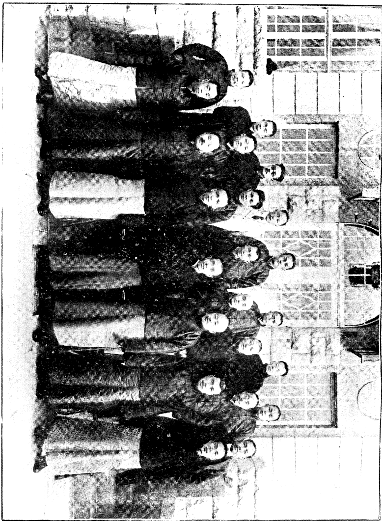
鐵 路 視 察 團 青 島 攝 影