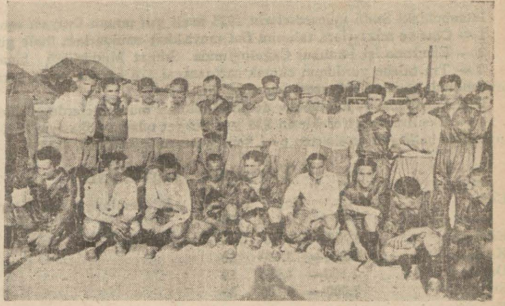
Altınordu — Çankaya takımları bir arada