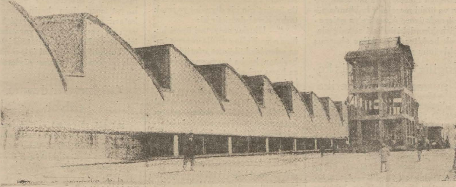
Kayseri dokuma fabrikasının genel görünüşü

İç Bakanımızla Sümer Bank direktörü dün akşam Kayseriye gittiler; salıya dönecekler