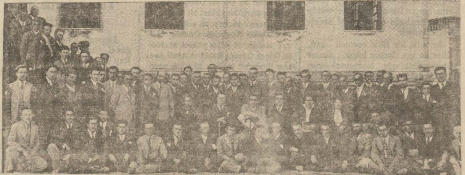
Yozgat öğretmenleri toplantı halinde

Toplantıda köy kanununun kültür, sağlık, bayındırlık alanlarındaki yeritilmeleri hakkında yeni programlar kararlaştırılmıştır.