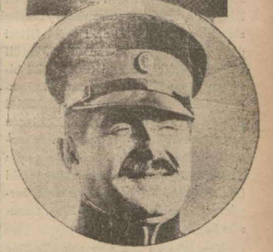
Prens Pol'un yeni kabinenin kurulması için görüşeceği B. Uzunoviç ile General Pera Zivkoviç

ginliğin kalkması ve iç durumun yavaş yavaş normalleştirilmesi sebeblerini hazırlıyacaktır. (Sonu 2 inci sayıfada)