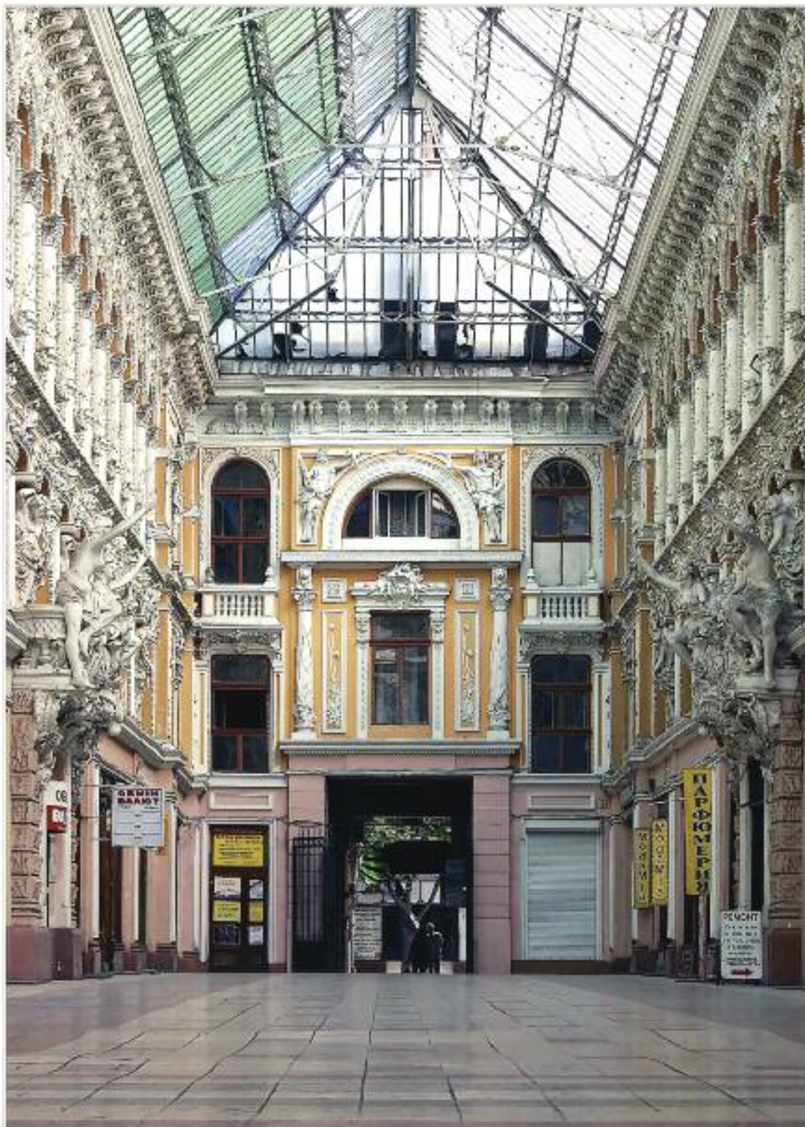
Пасаж у центрі Одеси. Крита галерея 1898–1899 рр. з рядом магазинів, що має виходи на паралельні вулиці Дерибасівську і Преображенську. Архітектор А. А. Влодек, скульптори Т. А. Фішель, С. І. Мільман, перебудовано в 1921–1923 рр.