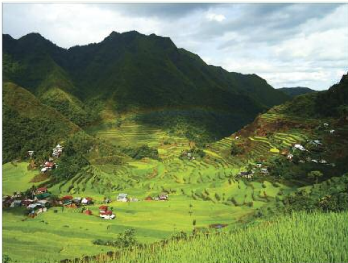
3 місце. Рисові тераси Батад у провінції Іфугао, побудовані понад 2000 років тому, Філіпіни.