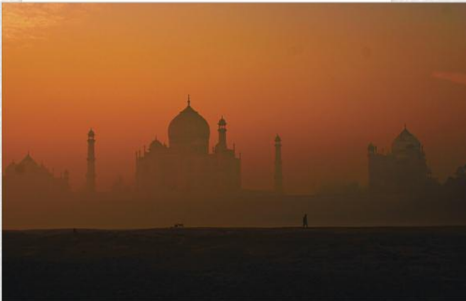
6 місце. Тадж-Махал, Індія.