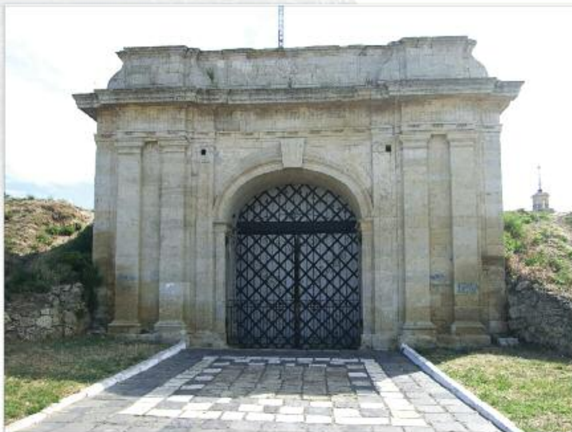
Найкраще фото з Херсонської області

Головний виробничий корпус солеварні, м. Болахів, Івано-Франківська область. Побудований 1855 року.