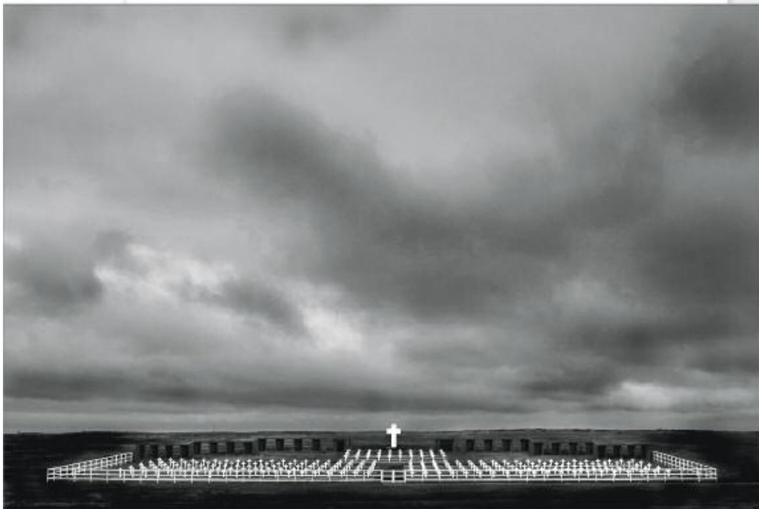
8 місце. Аргентинський військовий цвинтар, Порт-Дарвін, Фолклендські острови.