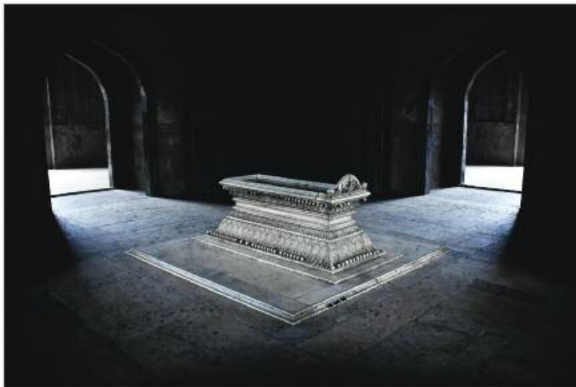
1 місце. Гробниця Сафдарджанга в Нью-Делі, Індія.

Пропонуємо Вам 10 фотографій-переможців конкурсу.