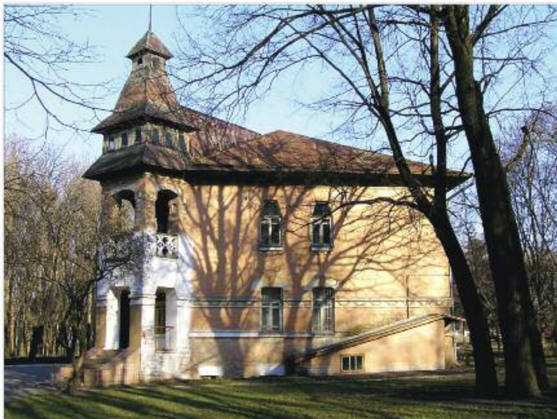
Найкраще фото з Харківської області

Головна будівля Селекційної станції, м. Харків. Побудована в 1909-1911 рр. за проектом Є. Н. Сердюка, М. Ю. Харманського у стилі українського архітектурного модерну. Головний будинок має асиметричну композицію з активним силуетом, створеним складними дахами та кутовою вежею з наметовим вінчанням та шпилем.