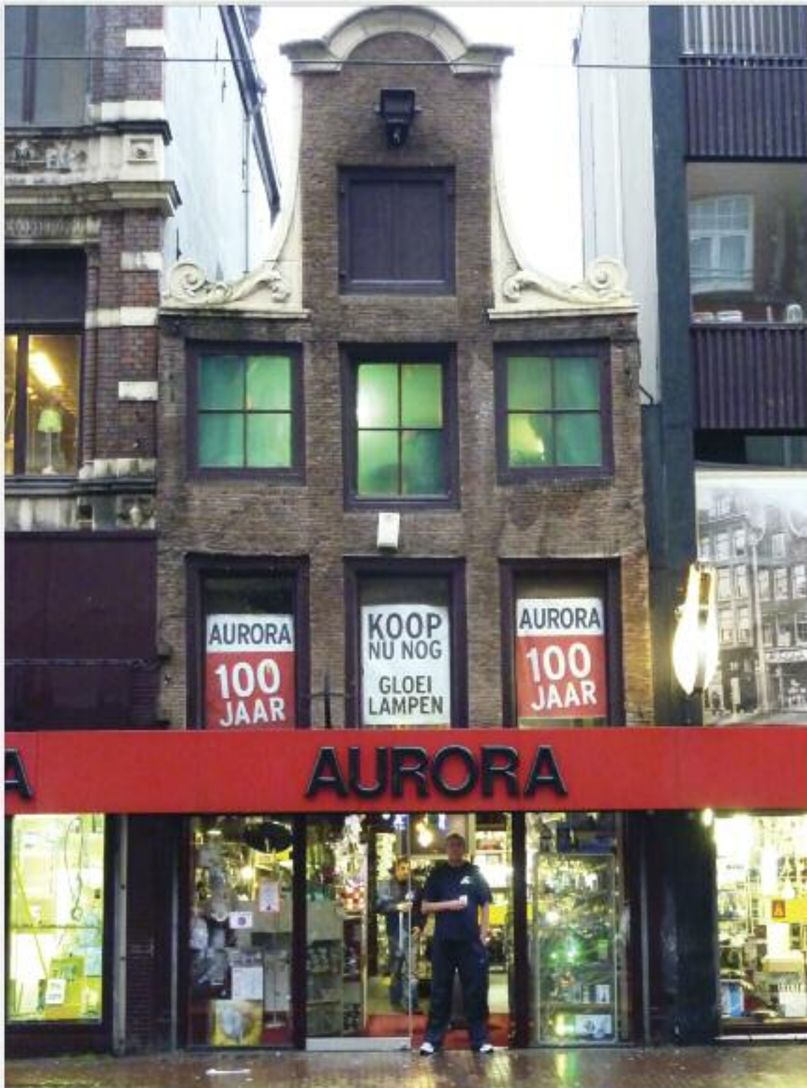
Фасад будинку на вулиці Vijzelstraat, 31 в Амстердамі.