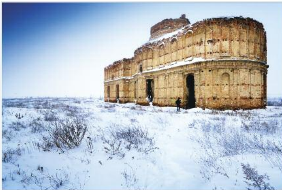
Монастир К'яжна на околицях Бухареста.

2012 року географія конкурсу охопила 35 країн світу з 4 континентів. Серед країн колишнього СРСР це Білорусь, Естонія, Росія і Україна. В базі даних конкурсу зібрано більш як 800 тисяч пам'яток, які пропонувалися учасникам конкурсу.