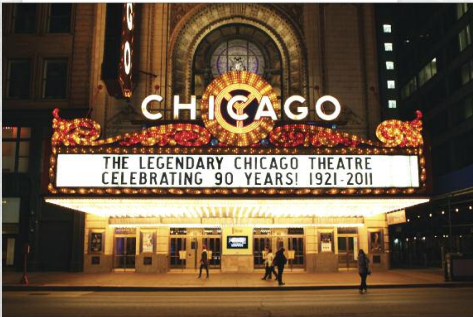
10 місце. Театр у Чикаго, США.