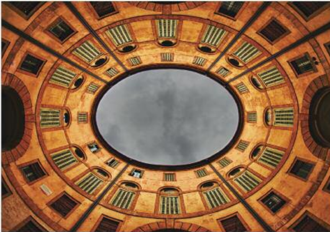
5 місце. Коло ротонди Фощіні комунального театру у Феррарі, Італія.