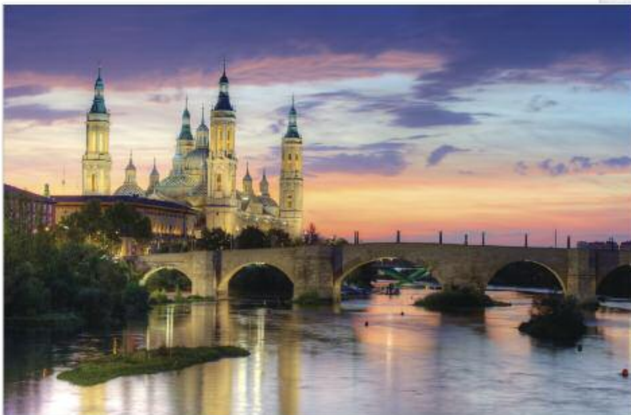
7 місце. Базиліка-де-Нуестра-Сеньйора-дель-Пілар-де-Сарагосса, Іспанія.