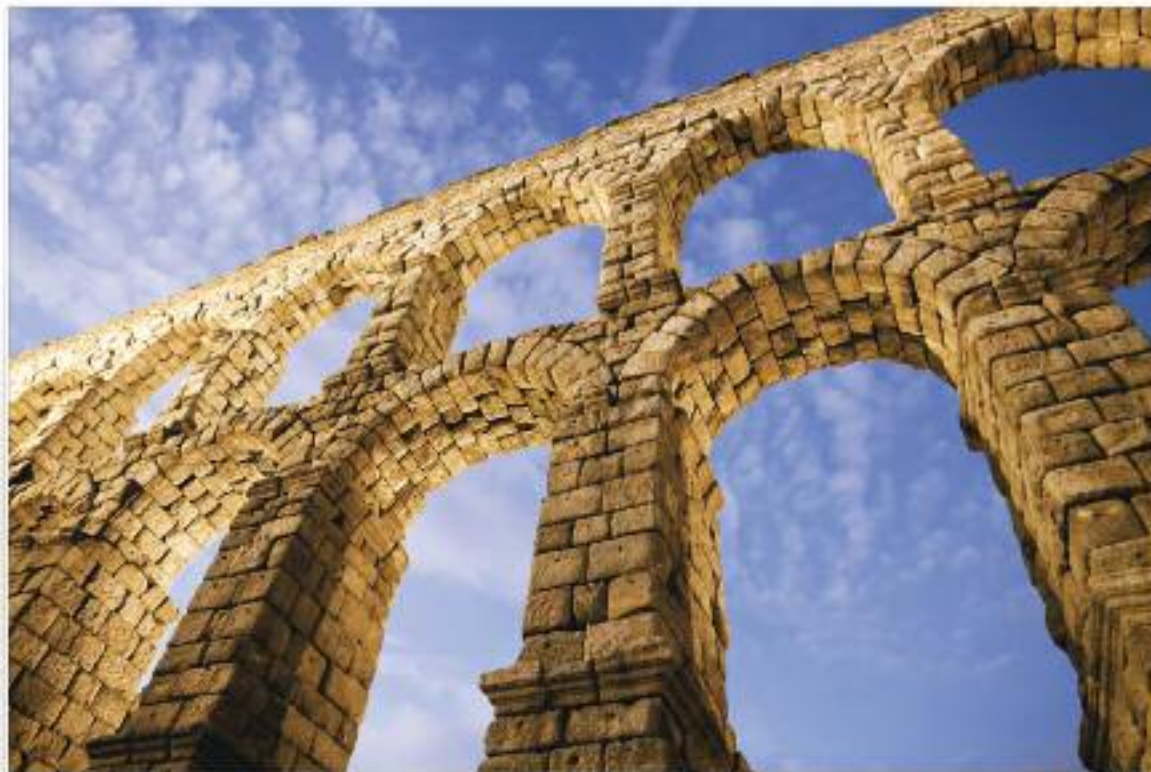
2 місце. Акведук римських часів у Сеговії, Іспанія.