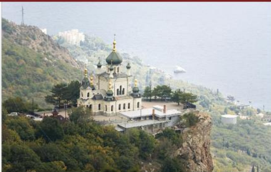
Церква Воскресіння Христового, смт Форос, АР Крим. Побудована у 1892 р. на Червоній скелі над Форосом за проектом архітектора Г. Чагіна коштом О. Г. Кузнецова у візантійському стилі.