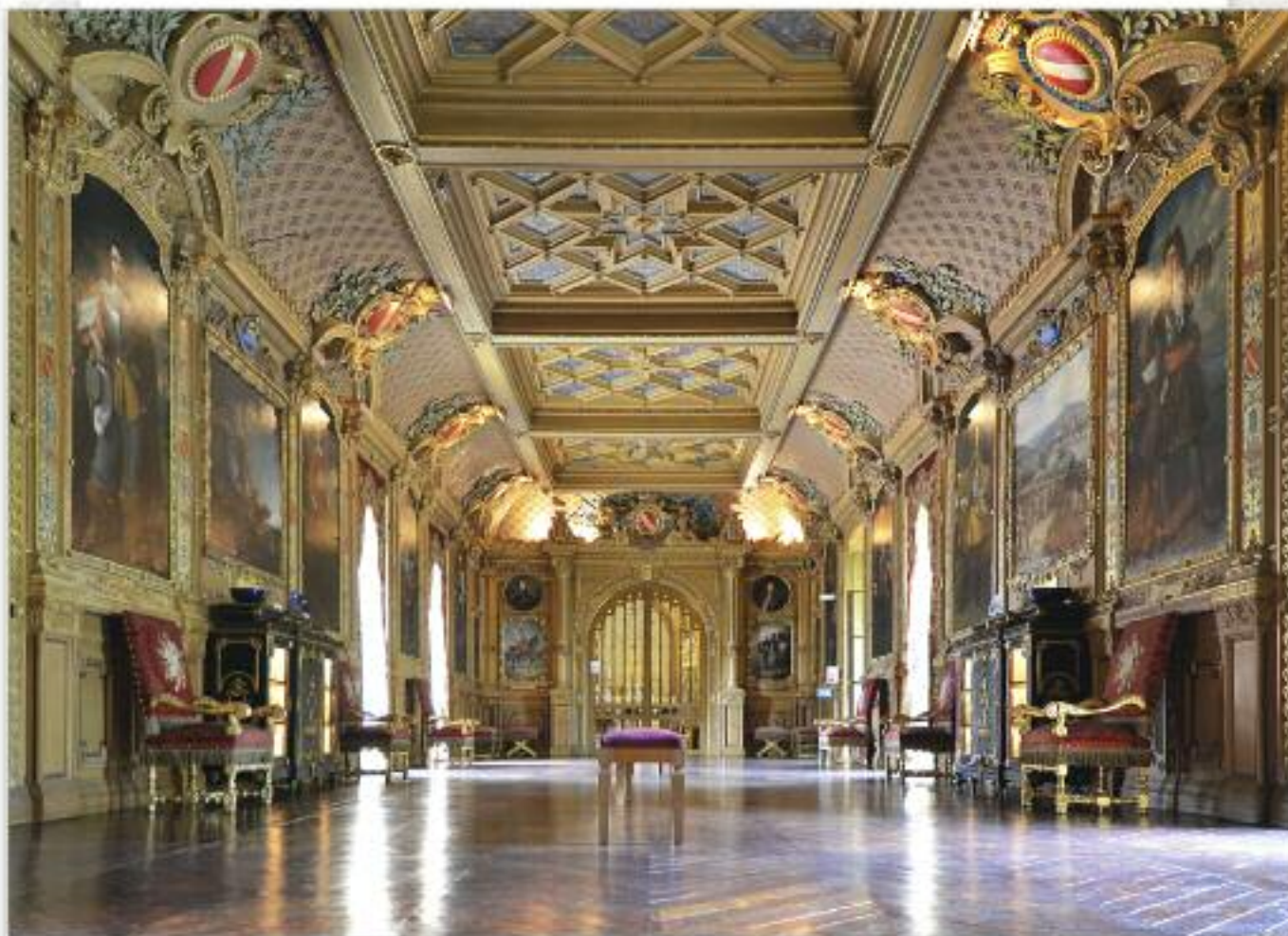
4 місце. Велика галерея Шато де Ментенон, Ер і Луар, Франція.