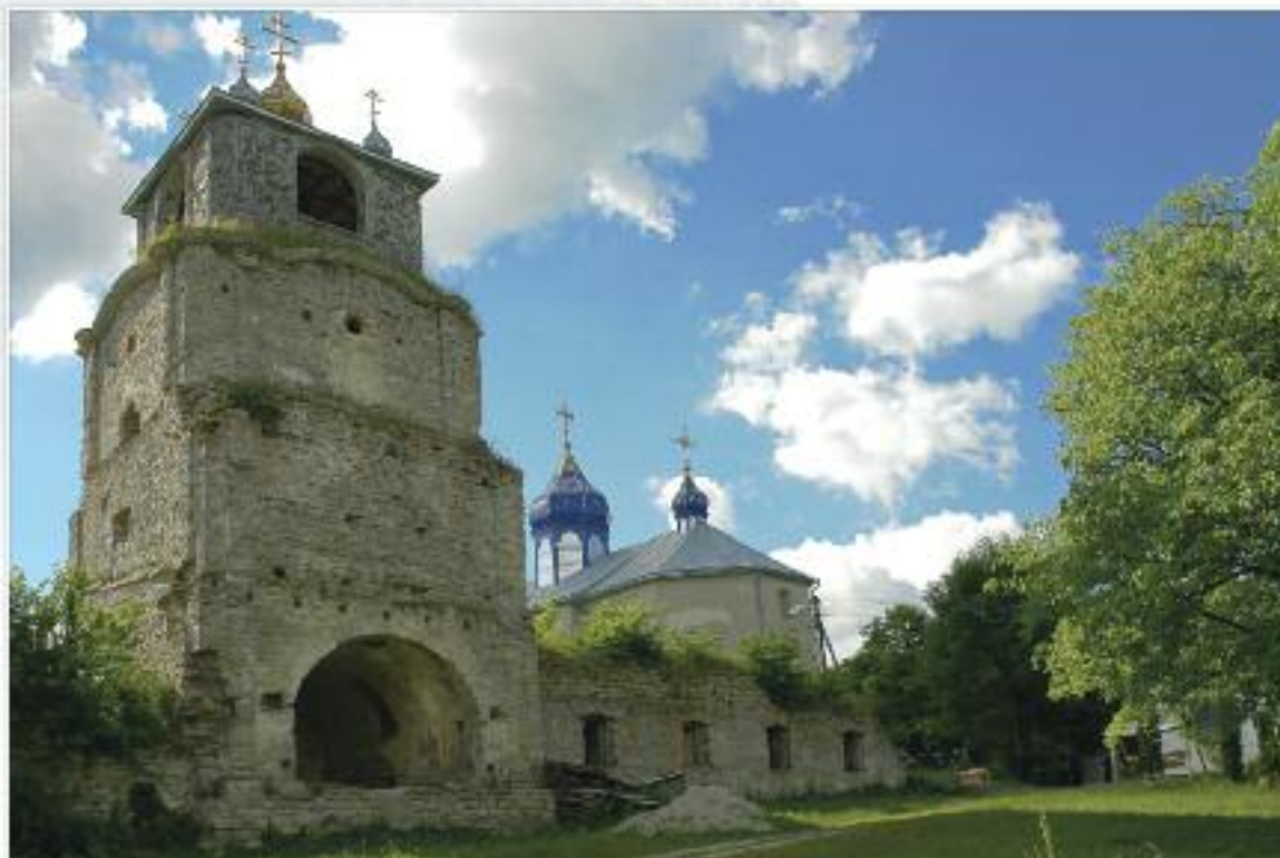
Троїцький монастир, с. Сатанівська Слобідка, Городоцький район, Хмельницька область. Пам'ятка XVI—XVIII століть. Монастирський ансамбль, що складається з Троїцької церкви, надбрамної дзвіниці з келіями, в'їзної брами та огорожі, 1744 року перебудовано в стилі бароко.