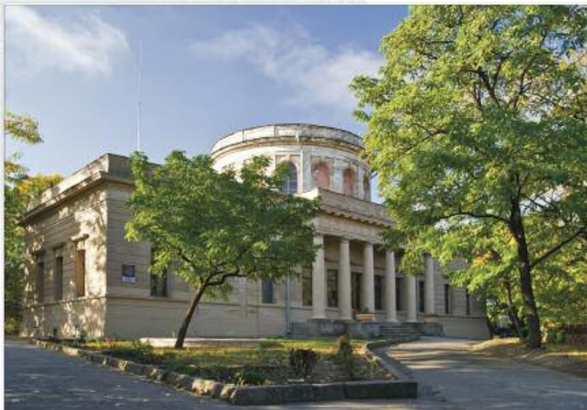
Найкраще фото з Миколаївської області

Головна будівля Селекційної станції, м. Харків. Побудована в 1909-1911 рр. за проектом Є. Н. Сердюка, М. Ю. Харманського у стилі українського архітектурного модерну. Головний будинок має асиметричну композицію з активним силуетом, створеним складними дахами та кутовою вежею з наметовим вінчанням та шпилем.