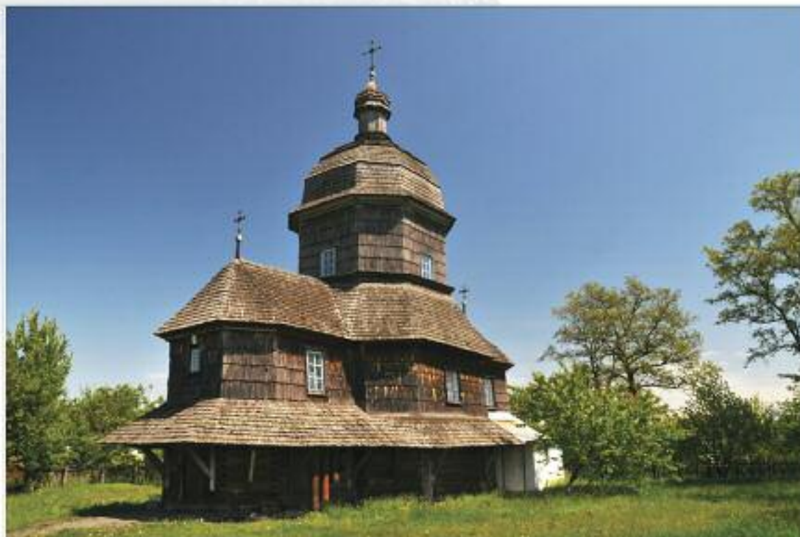
Троїцька церква, с. Дравівці, Золотоніський район, Черкаська область. Дерев'яна церква, побудована у XVIII столітті. Реставрована в 1989—1990 рр., в інтер'єрі зберігся стінопис XIX століття.