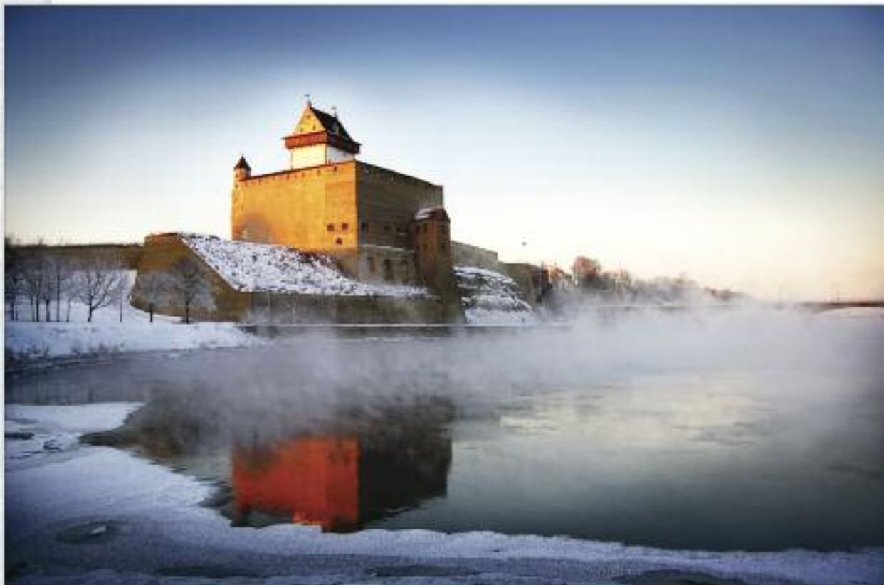
9 місце. Замок Германа, заснований данцями в XIII столітті, Нарва, Естонія.