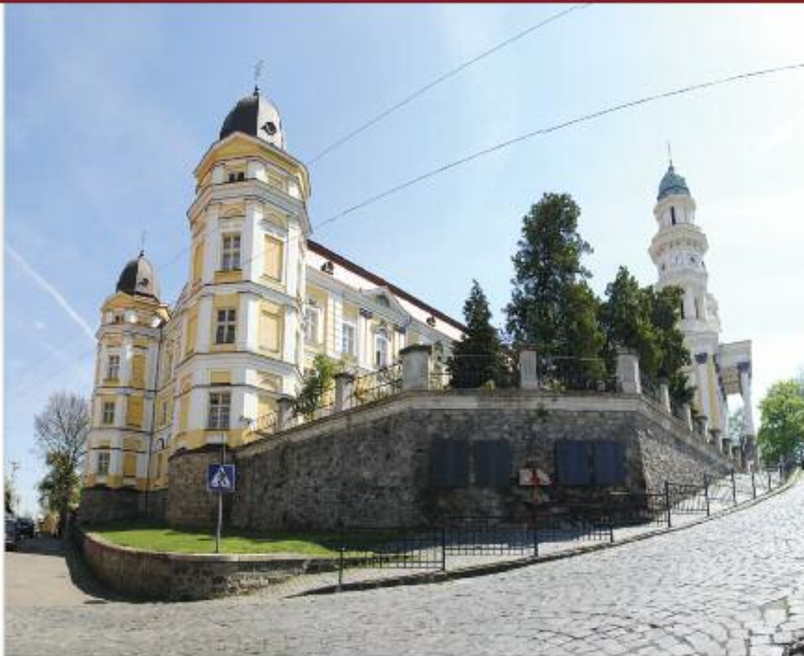
Найкраще фото із Закарпатської області

«Кам'яна баба» і плити комплексу «Кам'яна могила», смт Мирне, Мелітопольський район, Запорізька область.