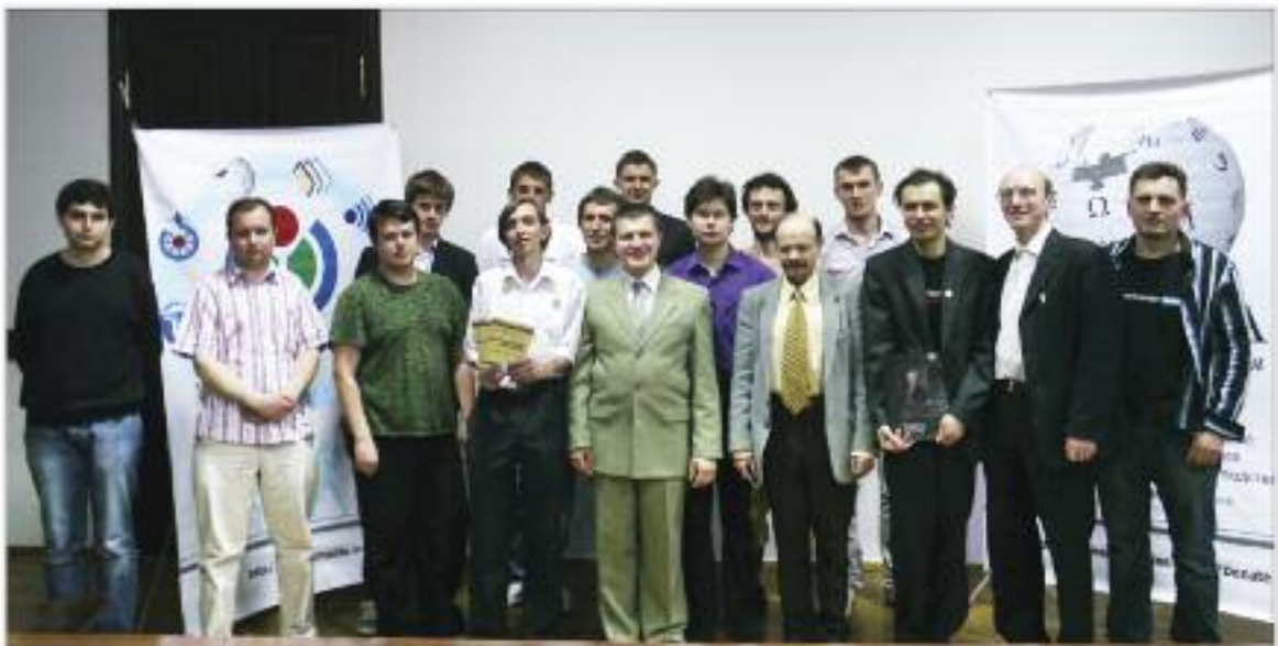
Учасники Другої української Вікіконференції. Харків, 28 квітня 2012 року.