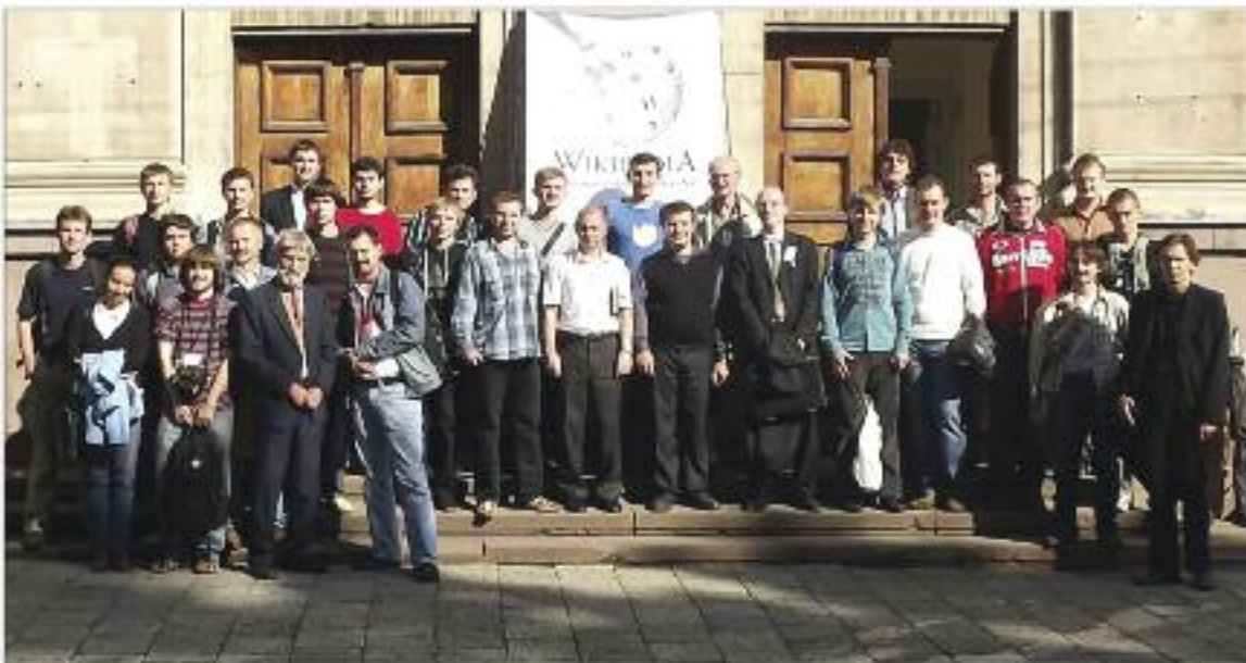
Учасники Першої української Вікіконференції. Львів, 17 вересня 2011 року.