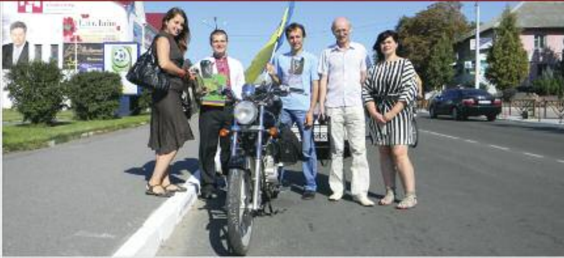
Вікіекспедиція до Макарівського району Київської області, 26 серпня 2011 року.

16 вересня — в рамках Форуму видавців у Львові проведено першу українську Вікіконференцію. Вікімедіа Україна також брала участь у Форумі видавців як учасник.