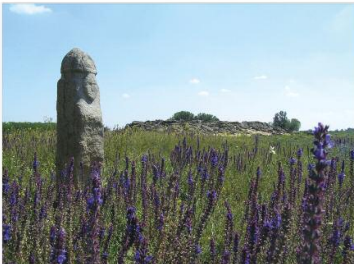
Найкраще фото із Запорізької області

Кам'яна могила — пам'ятка давньої культури світового значення. Вік — 22 тисячоліття до н.е. Національний історико-археологічний заповідник. Пагорб, що тисячоліттями служив людям вівтарем для відправлення обрядів, містить сотні унікальних стародавніх наскальних зображень — петрогліфів.