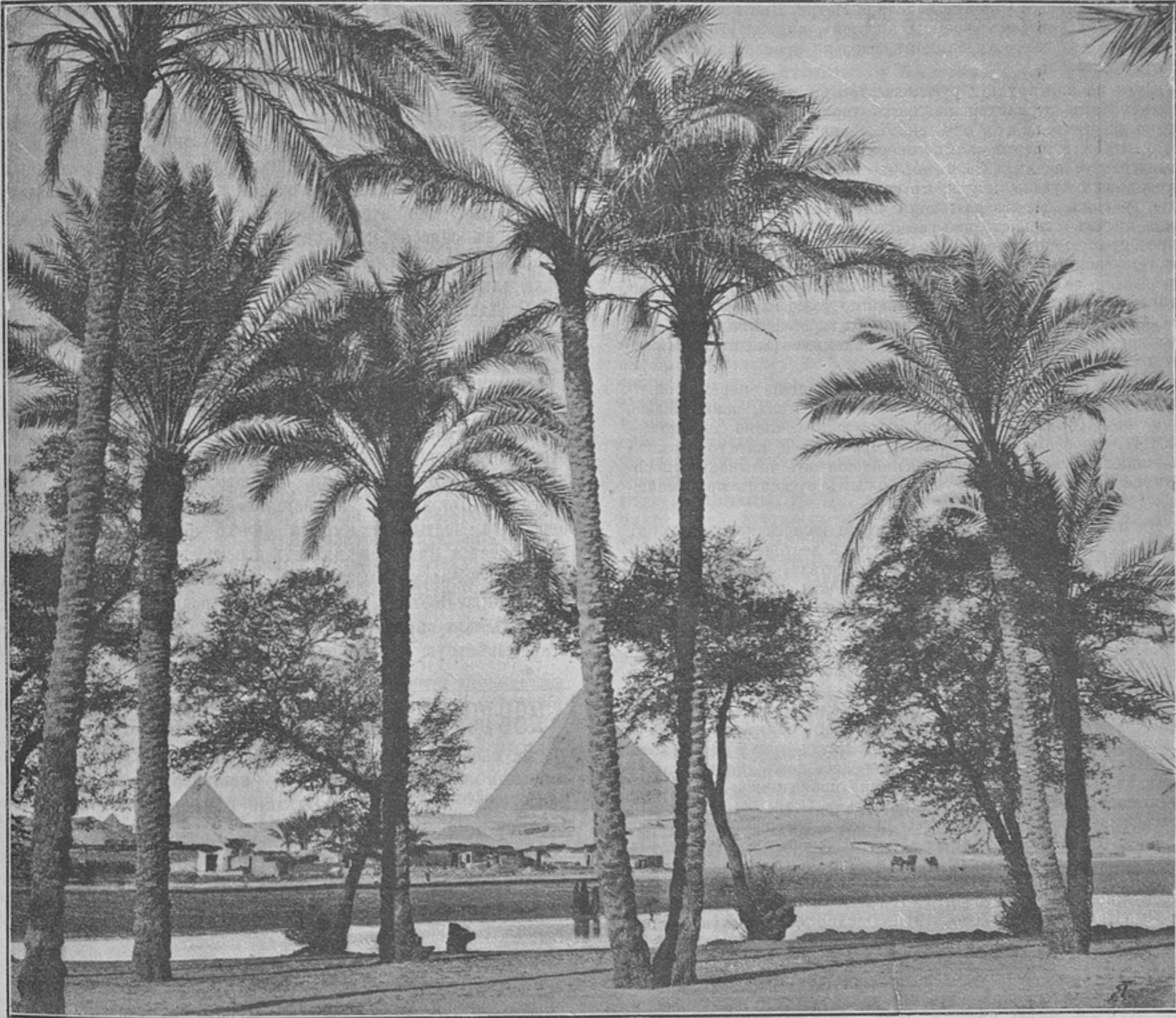
Видъ на пирамиды и дер. Гизехъ (Къ статьѣ «Каиръ—Пирамиды».)

— Этого еще не доставало, — отвѣтилъ я. — Я ужъ и билетъ взялъ и вещи носильщику отдалъ.