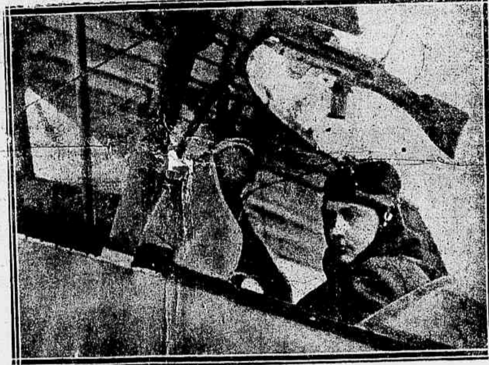
O avião francez Guynemer, um leg-primado herde da guerra no ar. Guynemer, que possui a cruz de guerra, a medalha militar e a cruz de legião de honra, segundo noticias aqui recebidas, já obteve nove vitórias inimigas

As communicações entre a Inglaterra e a Hollanda estão interrompidas