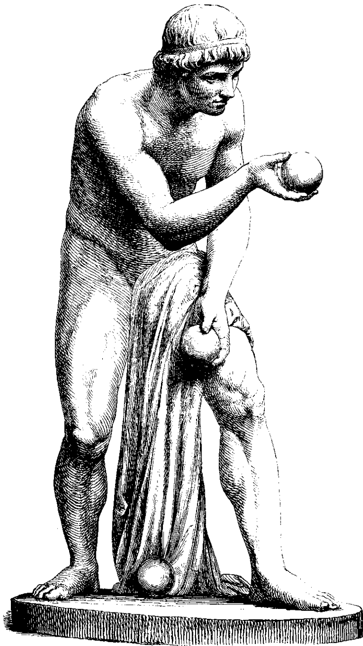
Bocciaspilleren, af Christian Freund.

Naar man ofte bebreider de Forfattere, der gjøre Politiken til Gjenstand for deres Virksomhed, at de ingensunde ere velunderrettede, at de tilbagekalde idag, hvad de have berettet som aldeles sikkert igaar, og at de, naar de give sig af med at spaae, som oftest ere høist uheldige Spaamænd, der af Begivenhederne modtage det ene Dementi efter det andet, have de dog den Trøst, at een af Verdens største, ja vi kunne gjerne sige dens allerstørste Politiker, vi mene de Franskes Keiser, ikke har været helbigere i sine Forudforudsigelser. Det er kun saa Dage siden, at han i Marseille i et poetisk Sprog