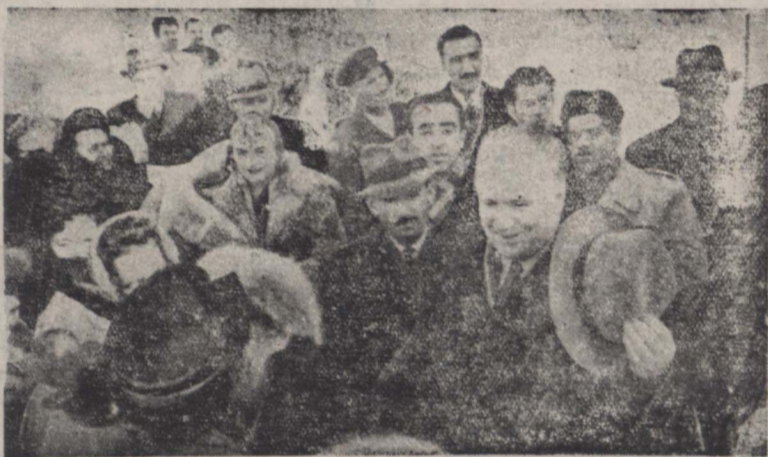
دو عکس بالا آقای لاورتین سفیر کبیر شوروی و همسر ایشان هنگام ورود بفرودگاه مهرآباد در میان همای از اعضای سفارت شوروی و سایر مستقلمین دیده میشوند.

بطوریکه در شماره دیروز اطلاع دادیم، آقای آناتولی لاورتین سفیر کبیر شوروی در ایران سه ساعت و نیم بعد از ظهر دیروز با آقای مسرغود بوسیله یک فروند هوا پیلای مسافربری بقیه در صبح چهارم