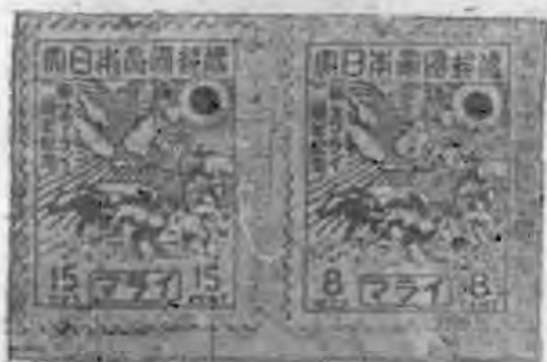
票念紀年週二生新亞來馬佔日