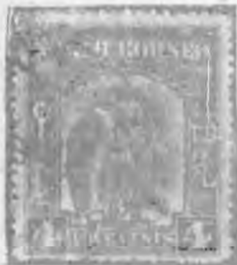
(1) 蓋加票娘慕 ↑