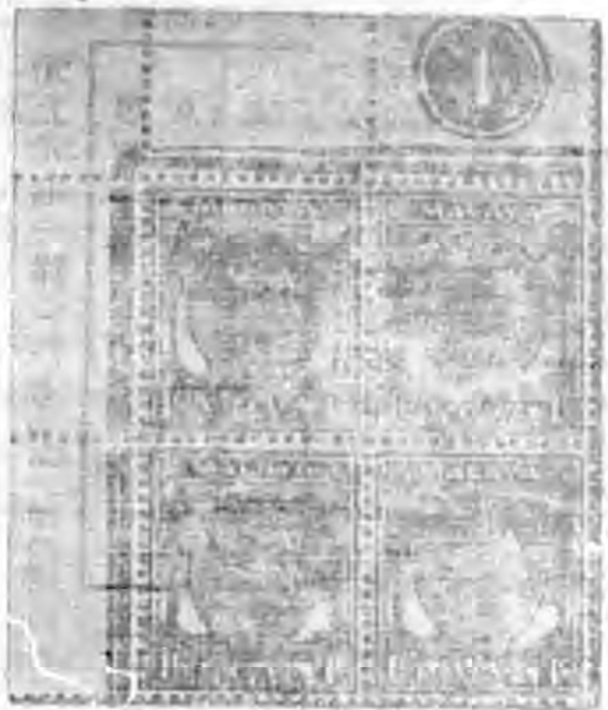
繞環條二線真版套

套版票有 如左圖 一角，一角二分，一角五分紅字，一分，二分，五分，一元，二元，與五元青紙，五元白紙。 總體票有六分跨蓋，一角五分及五分，五角破 等，二元，漏去雙線直劃廿五元破及各票連 等，在各票之中仍有一種「字與」之中 常見有多出一小點者，如圖 MALAYA 之 版，之暗記耶？有待高明之士指正，除此之外 仍有一種灰色（戰前）之 BMA 票，未經郵 政府發售者，聞是票印後因與 O 灰色相同， 且存不多（吉隆坡）故未採用，所謂組外票者 為集者所得，是票未列入目錄中也，又當在 初集十五元之印花稅票（附圖），亦曾經馬來 亞內地長用作為郵資者，是種票亦加蓋有 BMA