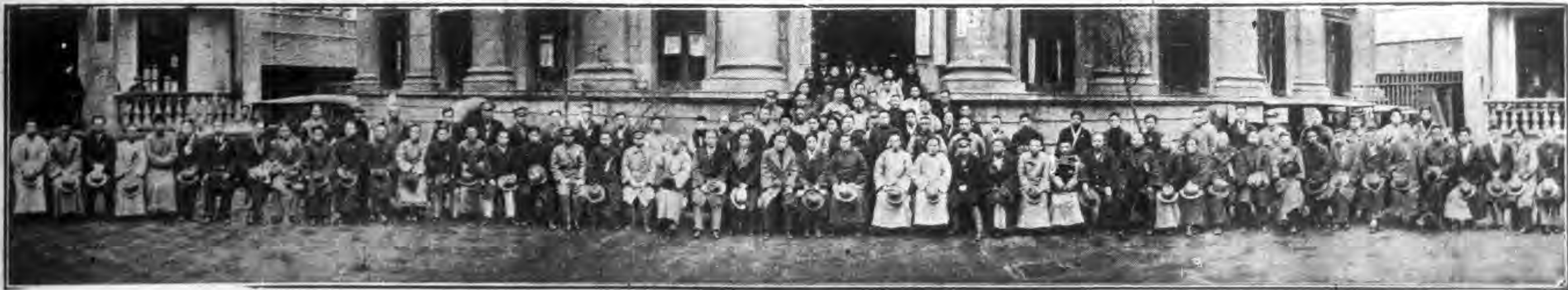
員委央中迎歡部黨省北湖黨民國國中 影攝會大生先甫養曾