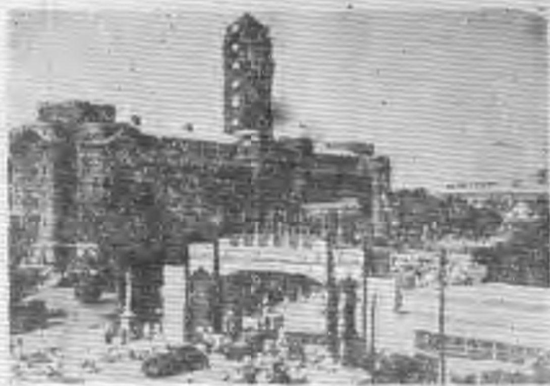
臺灣省博覽會壯觀

在博覽會主體的每一層列館，就是剛修完工的省府大廈，鋼鐵的巨大的柱礎再加上燦爛的裝飾，更是富麗堂皇了，據說很多的參觀者是專