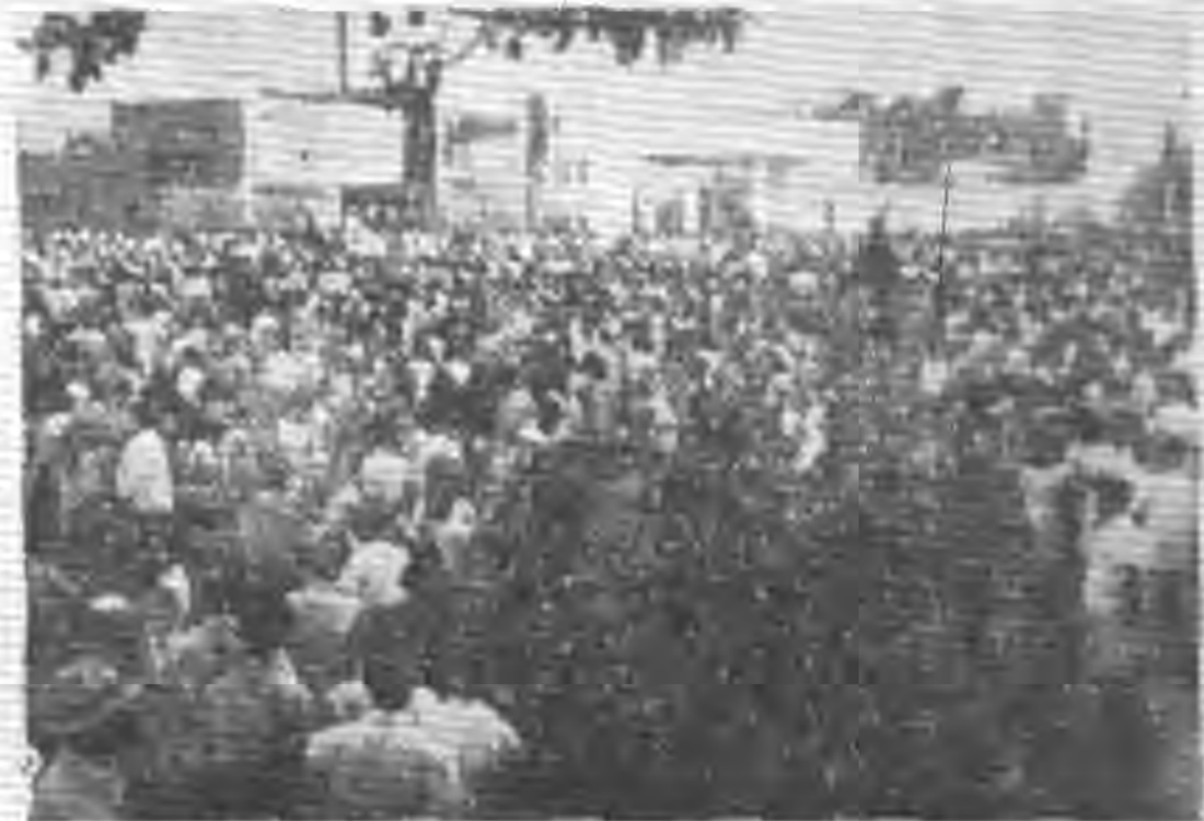
參加博覽會開幕之羣衆

管理員，除有本有各式郵票展覽外，並裝有收音機及自動式電話機等，當場表演及解題給參觀的人們，觀察尤其喜歡試一試這自動電話