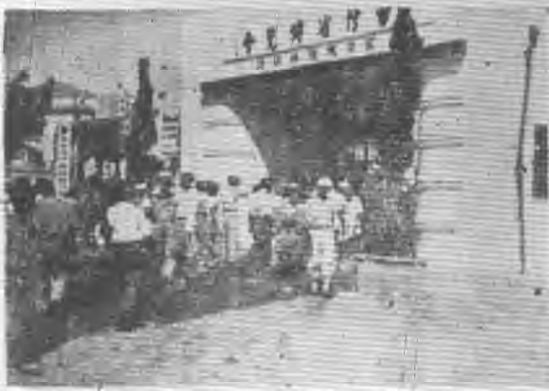
博覽會二場會覽博 景前場會二場會覽博

博覽會經過幾天的陣軌之後，也就漸漸冷清的蕭條了。比較熱鬧的是博覽會國貨展覽品推廣部，在右側大廳的範圍方面，自十一月二日開放以來，陣軌至今不曾減，因爲這裡可以買到一些出產上，雖經日久在物品，價格較前稍有起色，但較之前期售價，在較之市場上出現時的價格仍低，於是市民好做家，於此市好做家，應以食一般學生到這裡來了，幾種便宜較多的物品，其價比平時之廉，其是無以復加，便宜物品除有一定之限制外，並須於每日午後二時起，先持