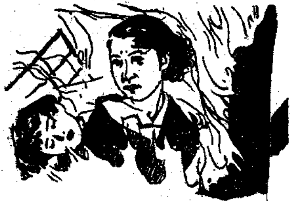
苦我什麼也願意受，好今天還是再買點玉米粉和紅薯混着再說吧。你就去買，再選恐怕什麼也會買空了。這叫做做飯的，叫子濕碗而喉咽的說着。張一心突的像