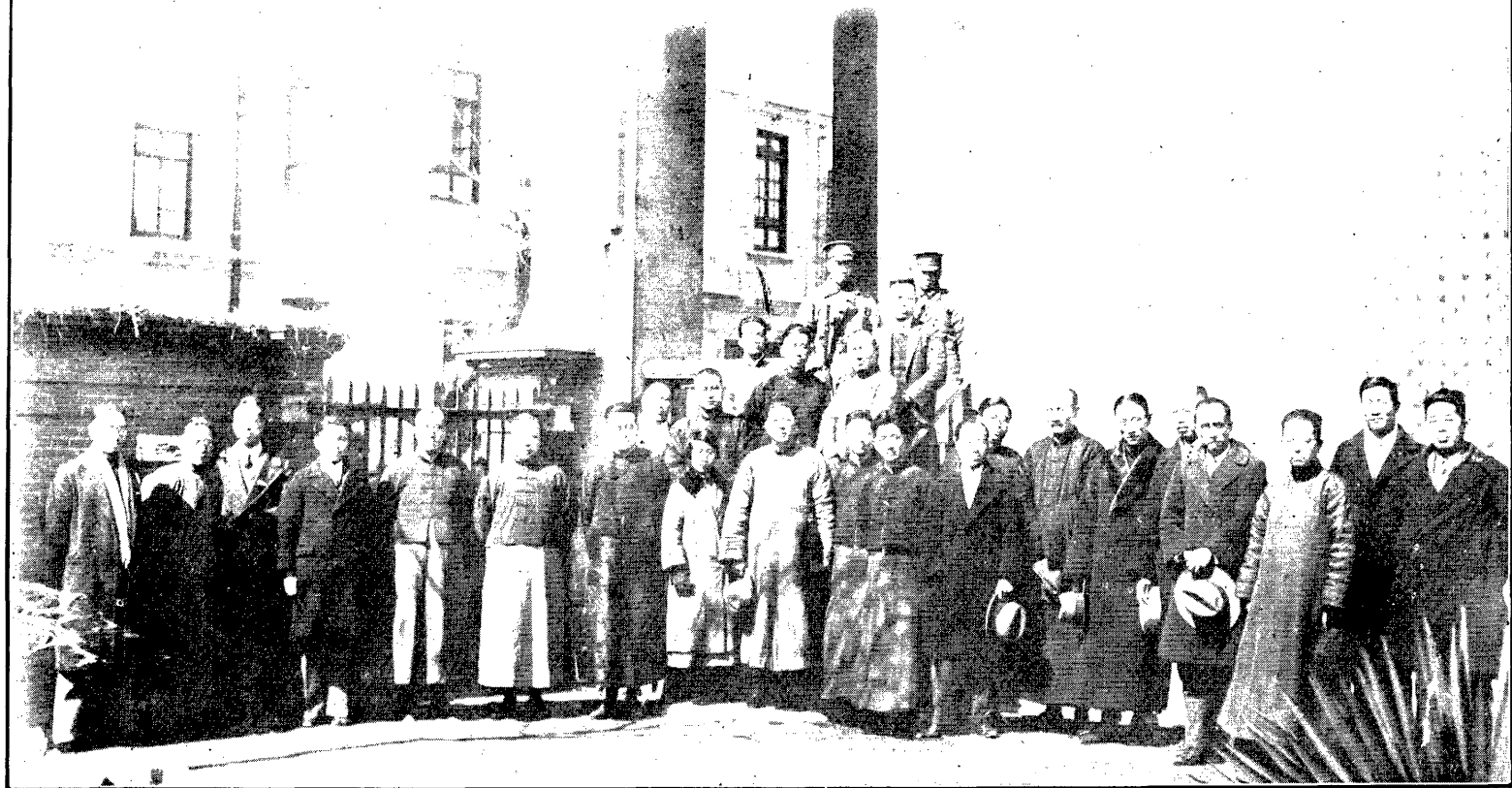
委 員 及 職 員 攝 影