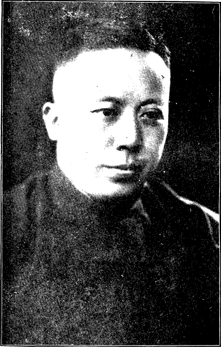
何 主 席 玉 書 肖 像