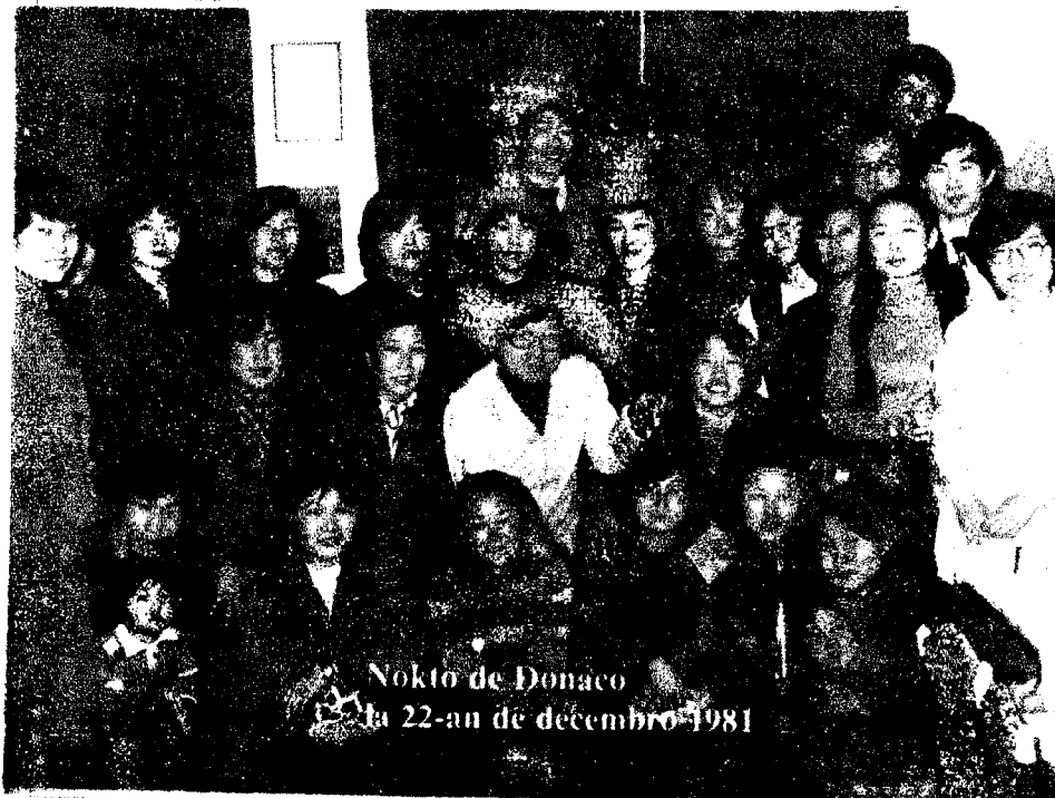
Nokto de Donaco la 22-an de decembro 1981