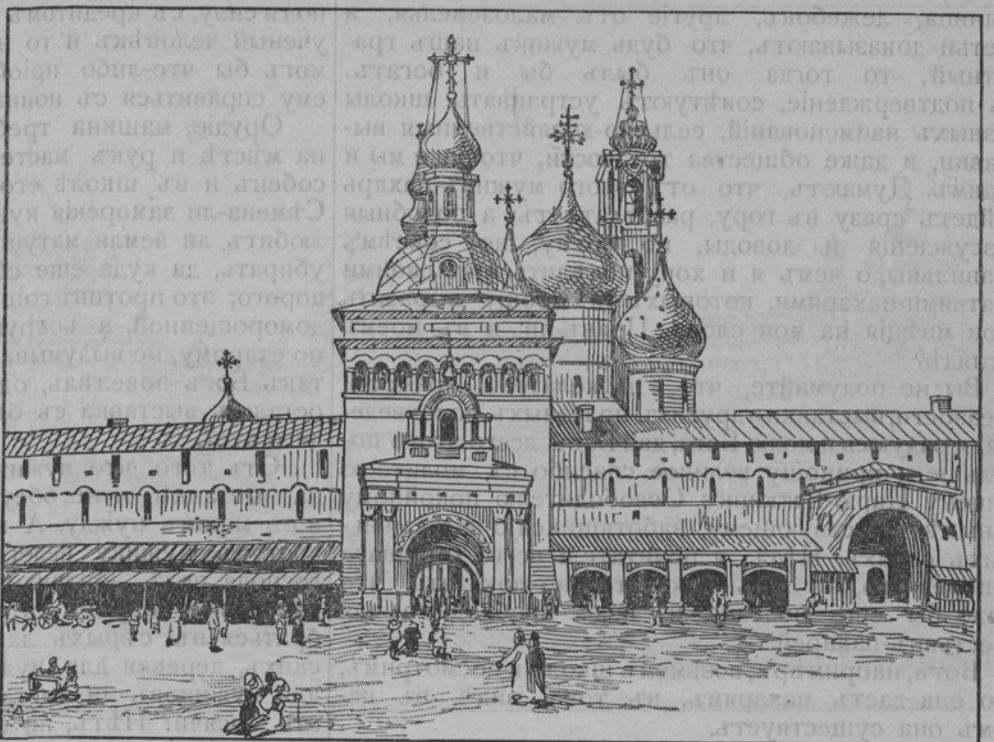
Святая ворота въ Троицко-Сергіевой Лаврѣ.

И старуха навзрыдъ зарыдала. Я молчалъ. Настала тихая, теплая ночь. Все озарилось луной, звѣзды мигали на темномъ, глубокомъ небѣ и мнѣ казалось, что это души загубленныхъ дѣвушекъ тоскливо смотрятъ на погубившую ихъ землю.