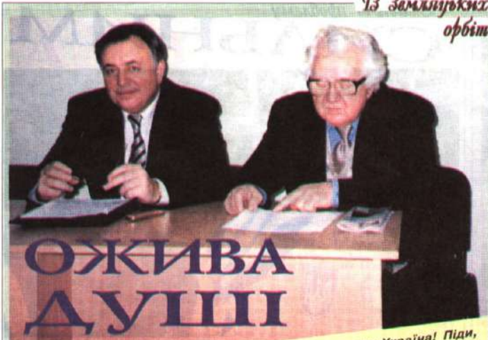
Із Земляцьких орбіт