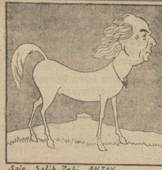
Sair Salih Zeki AKTAY

Havanın çok güzel olması halkın neşesini bir kat daha arttırmıştı. Beyoğlu caddesi, Taksim civarı insandan (Devamı 5 inci sahifede)