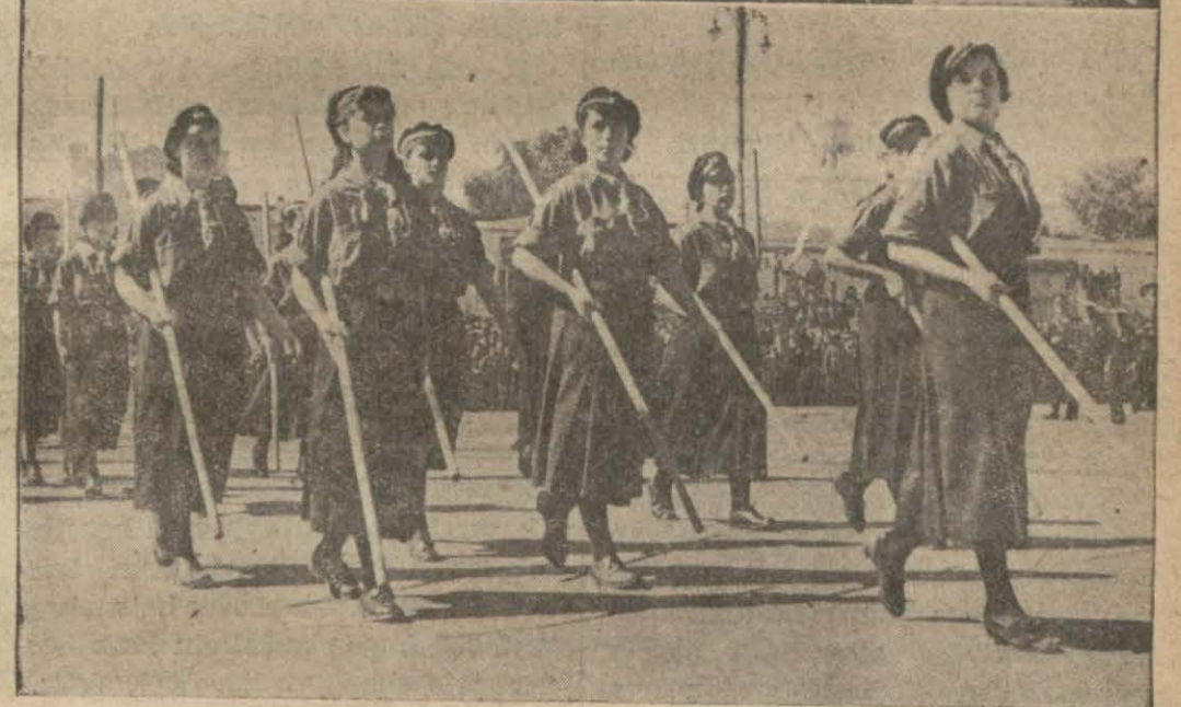
Yukarıda parti ocak heyetleri, aşağıda kız izciler geçiyorlar

İstanbul, kurtuluş gününü dün parlak surette kutladı. Halk erkenden sokaklara dökülmüştü. Her taraf bayraklar, çiçeklerle donanmıştı.