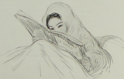
Lecture au lit