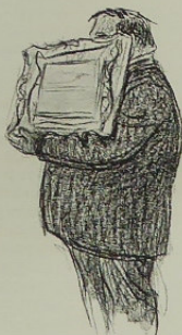
Bibé de Quimper

Comme il écrit en ce moment, pour les lecteurs d' A.B.C. Magazine d'Art , une série d'articles sur les techniques de la taille-douce, je suis bien aise de pouvoir renvoyer à un guide qui a les meilleures raisons du monde d'être bien informé. Il ne m'en voudra pas, toutefois, d'empêcher un peu sur son domaine en ajoutant que l'eau-forte en couleurs telle qu'il la pratique — celle où l'épreuve s'obtient par le tirage superposé de plusieurs planches repérées donnant cha-