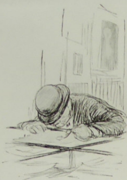
A l'Hôtel des Ventes