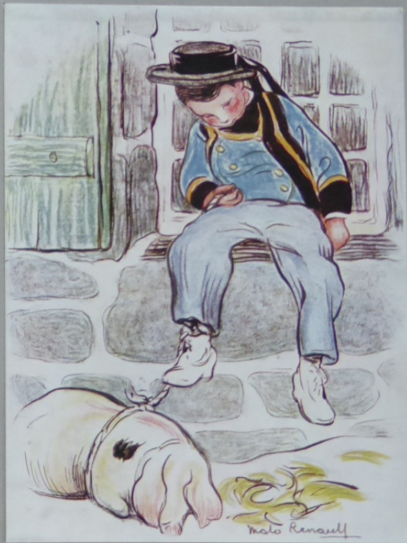
DESSIN REHAUSSÉ par MALO RENAULT