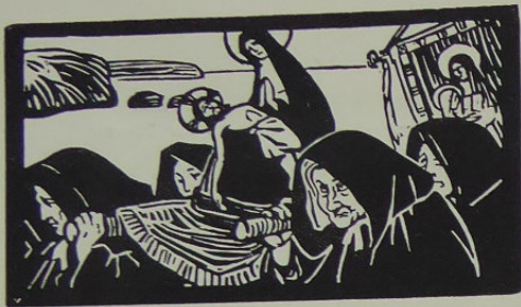
Au Pardon de Sainte-Anne-la-Palud, gravure sur bois