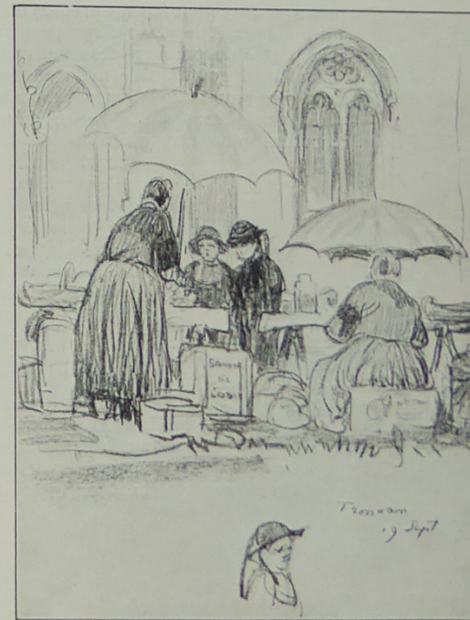
Au pardon de Tronoan