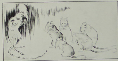
Souris et rat (pointe sèche)