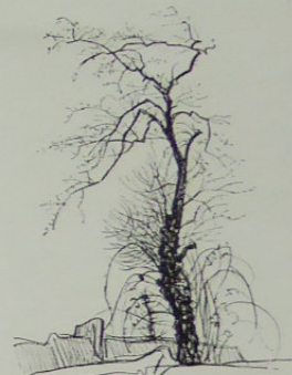
Arbre en mars

Enfin — et l'on ne saurait trop insister sur ce point — son art savant et réfléchi ne se réclame que de l'observation et de l'étude d'après nature. « Je n'invente absolument rien », dit-il volontiers, entendant par là que tout ce qu'il imagine a pour point de départ la chose vue, la chose notée sur le vif. Dès le collage, il dessinait avec passion. Depuis lors, il a toujours dessiné, toujours et partout. Aussi le plaisir de feuilleter ses cartons tient-il non seulement à la qualité mais