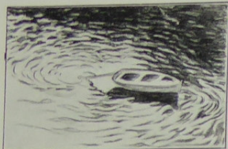
Rides sur l'eau

à la richesse de ce que l'on y découvre. Bêtes et gens, fleurs et fruits, mers et cieux, villes et campagnes, de même que tout est pour lui sujet d'étude, de même tous les procédés lui sont bons : plume, crayon, pastel, aqua- relle, peu importe; le meilleur sera celui qui