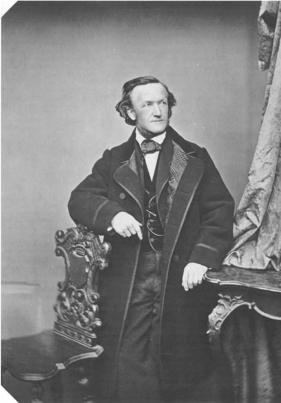
Richard Wagner

Ook met de techniek van de 'Leitmotive' weet Wagner de immense muzikale constructie van 'Parsifal' als een coherent geheel samen te houden. De 'Leitmotive' zijn veel meer dan signalen of 'verkeersborden'