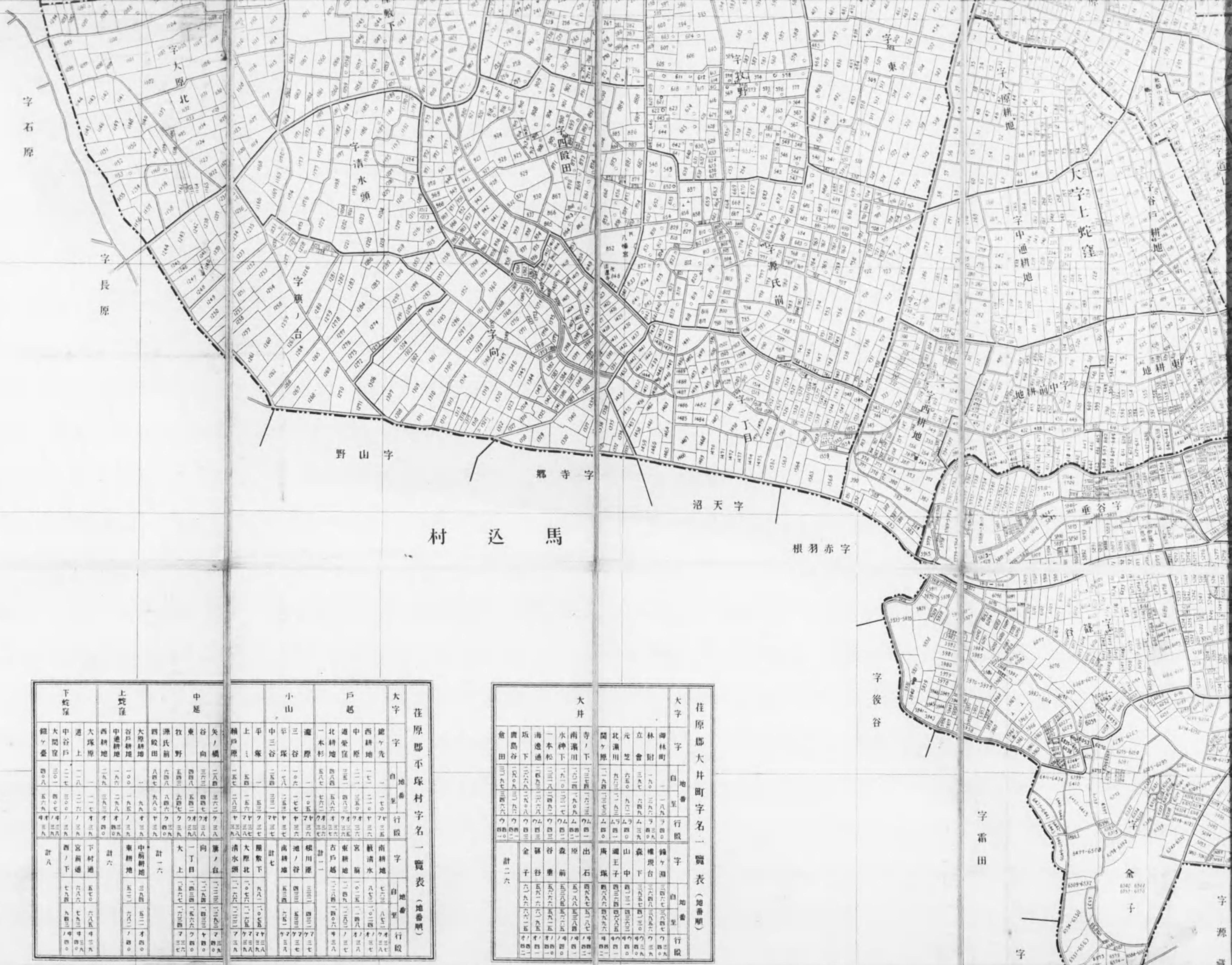
荏原郡平塚村字名一覽表 (地番順)