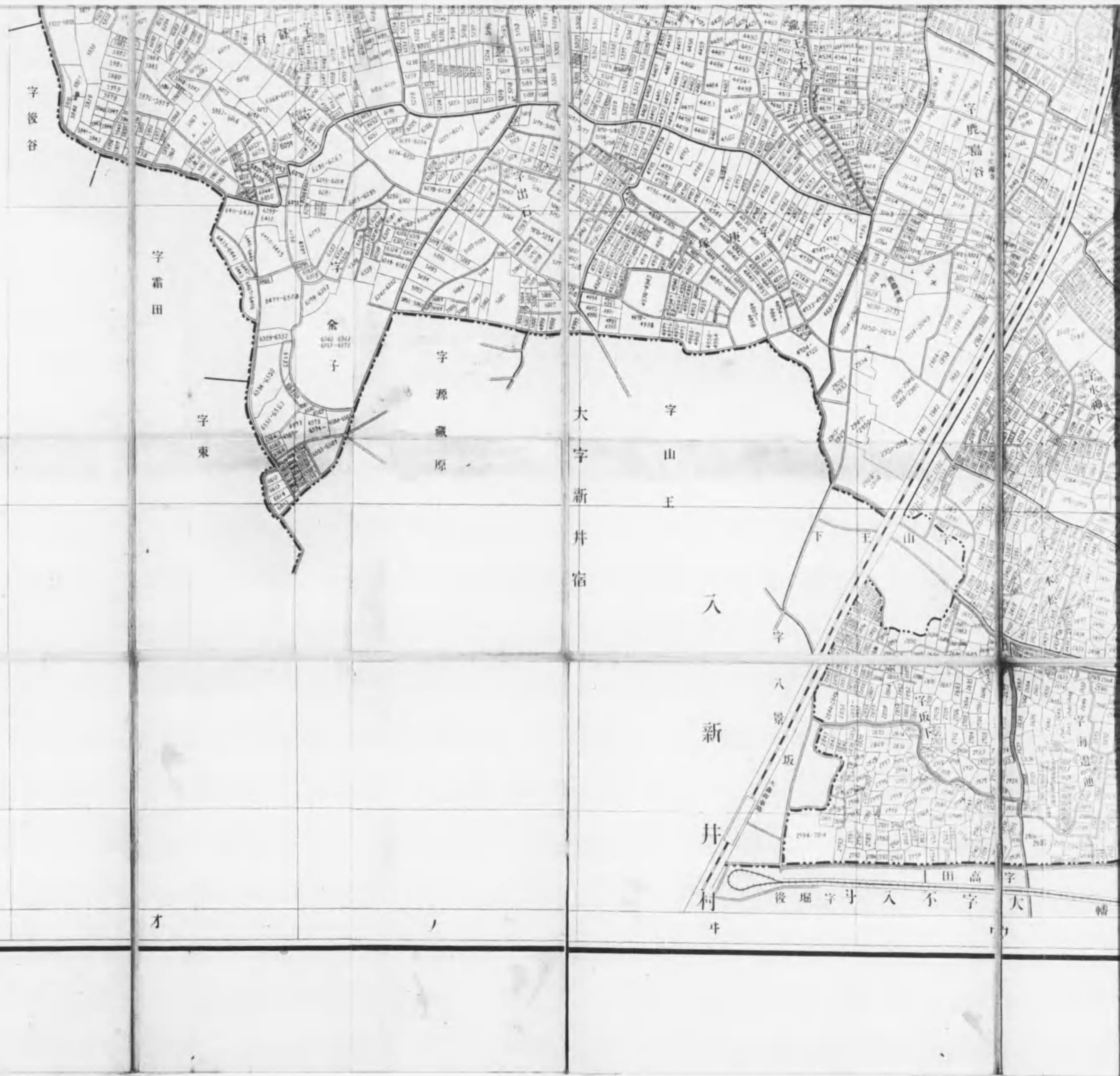
在厚郡大井町字名一覽表 (地番順)