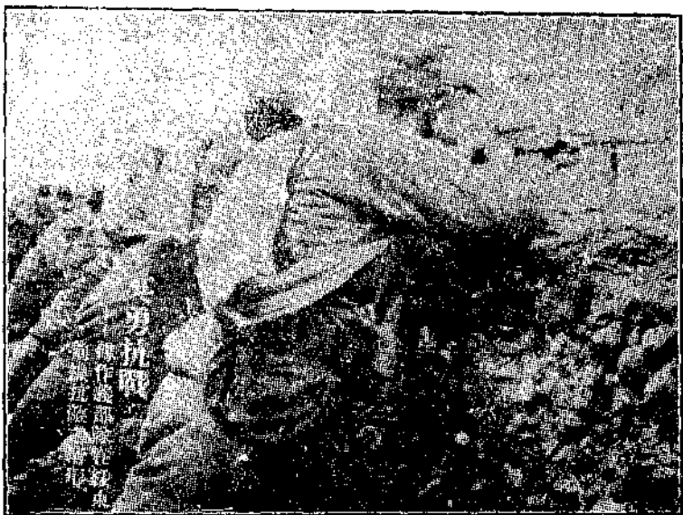
抗戰才是我們的出路

出版兼發行者 北平外灘 胡同二十號 史地補充材料編 譯社 總編輯者 李旭 和經售處 外廠旬新華書 店 零售每冊三分 預定全年國內 郵六角，國外 一元四角