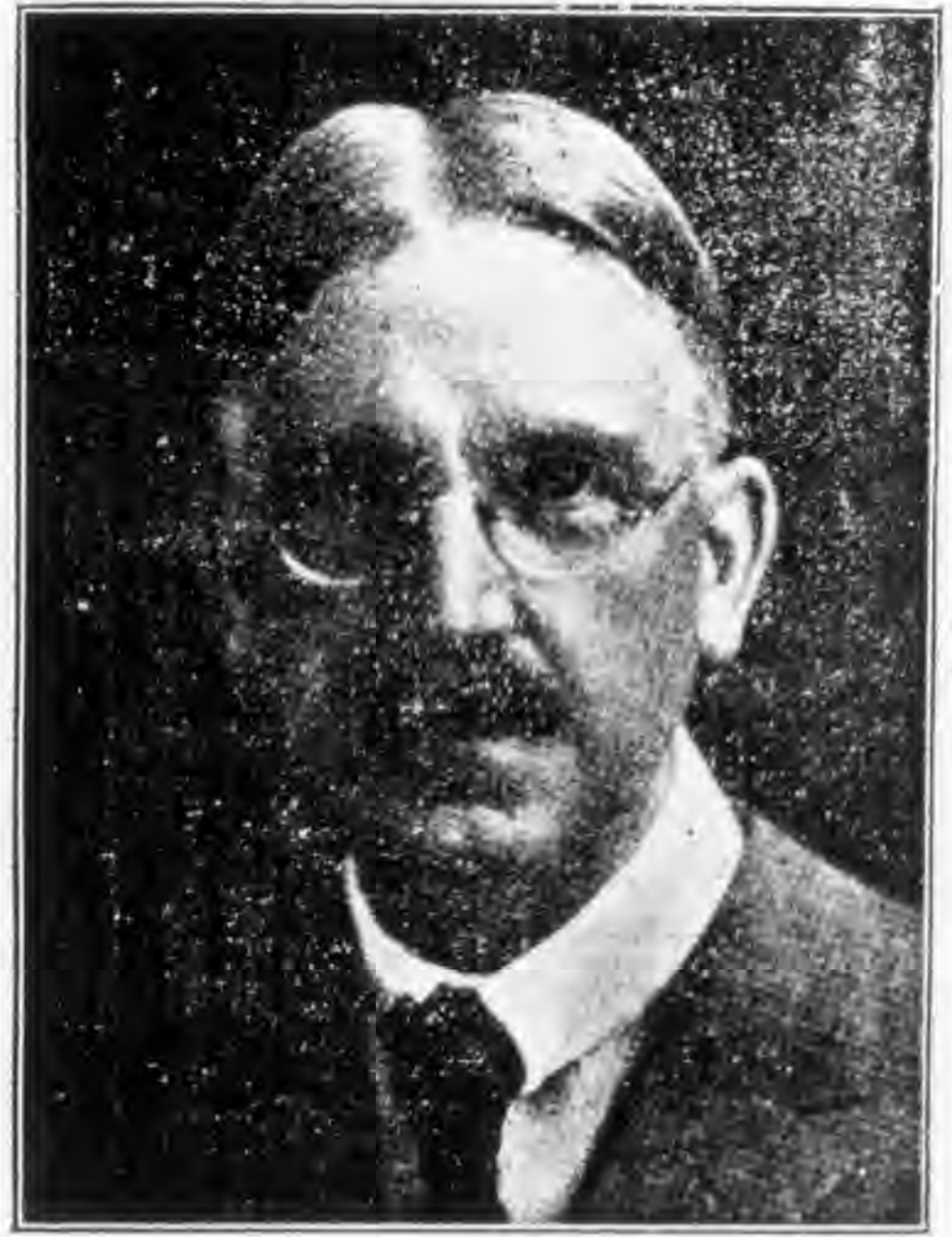
實用主義教育家 杜威 (John Dewey)