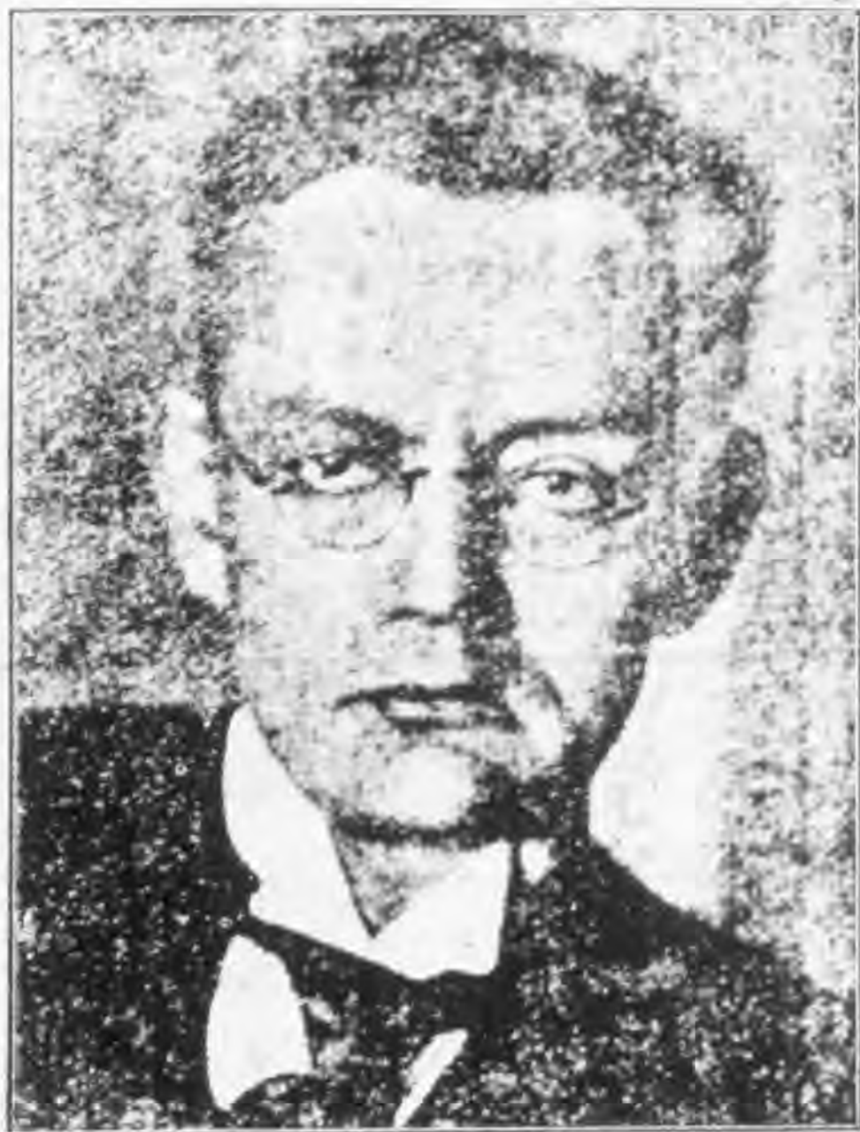
現象學派教育家 克里克 (Ernst Kriek)