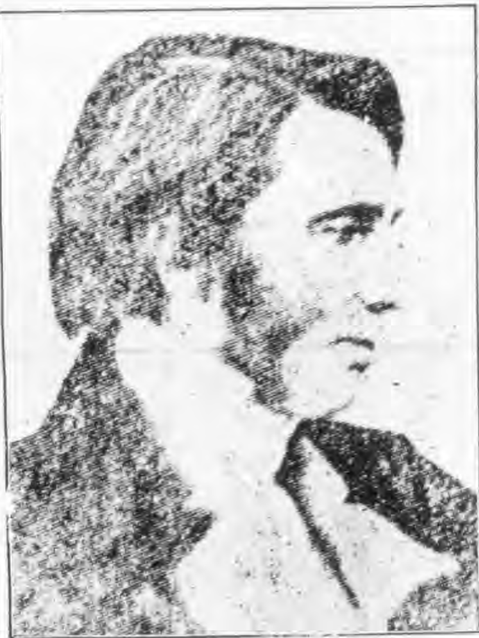
美的教育學家 羅斯金 (John Ruskin)