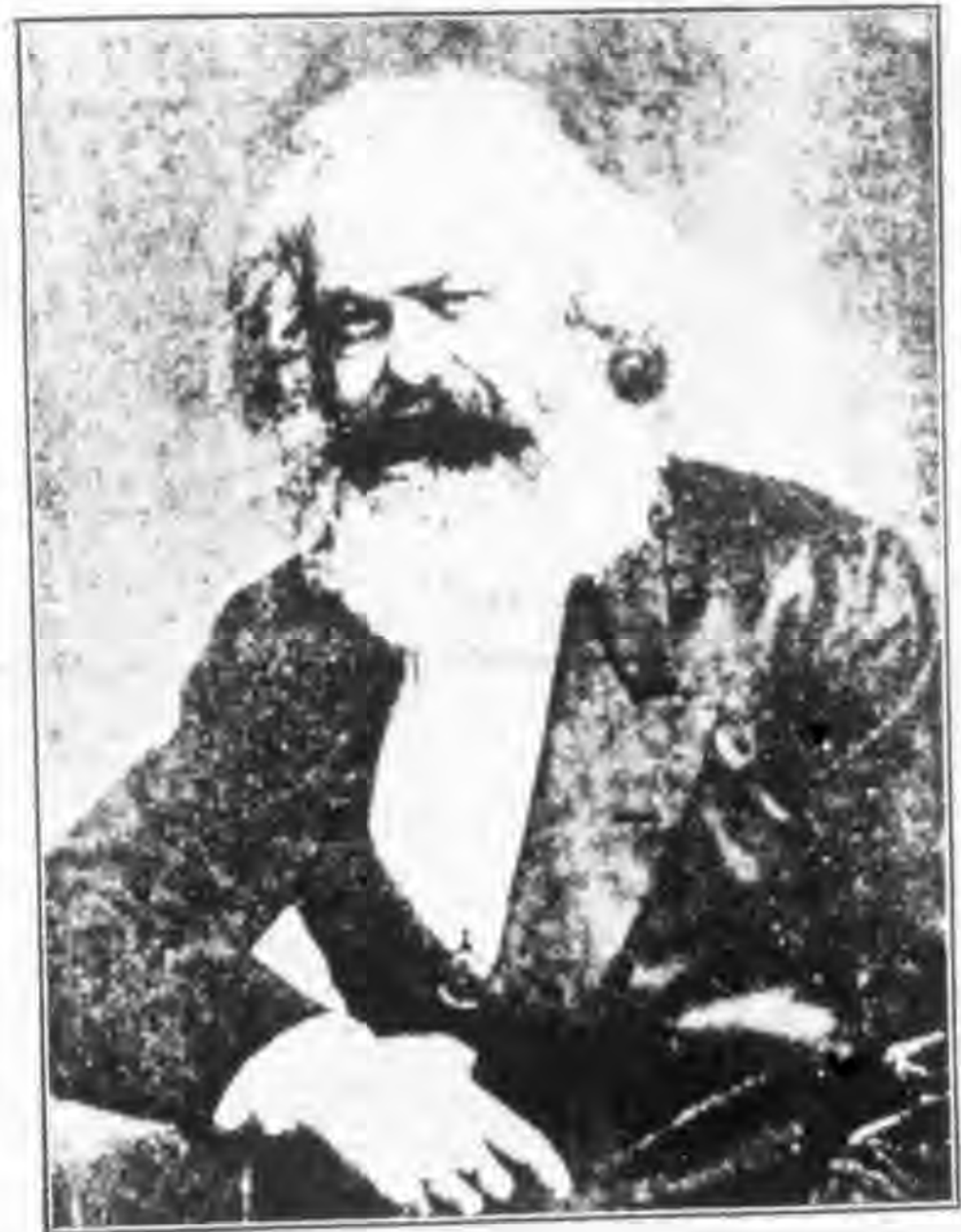
社會主義思想家 馬克斯 (Karl Marx)