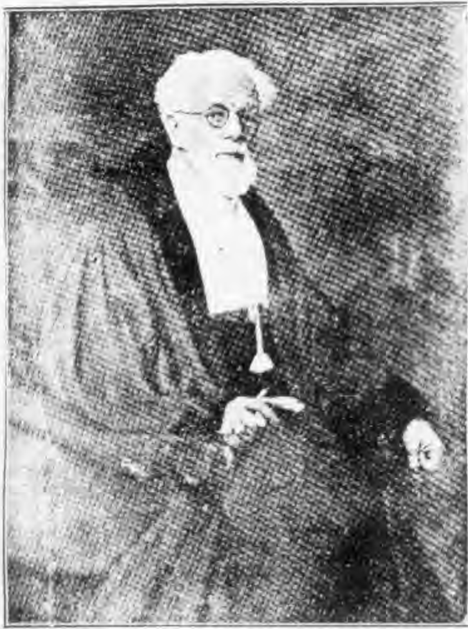
勞作主義教育家 克欣斯泰奈 (Georg Kerschensteiner)