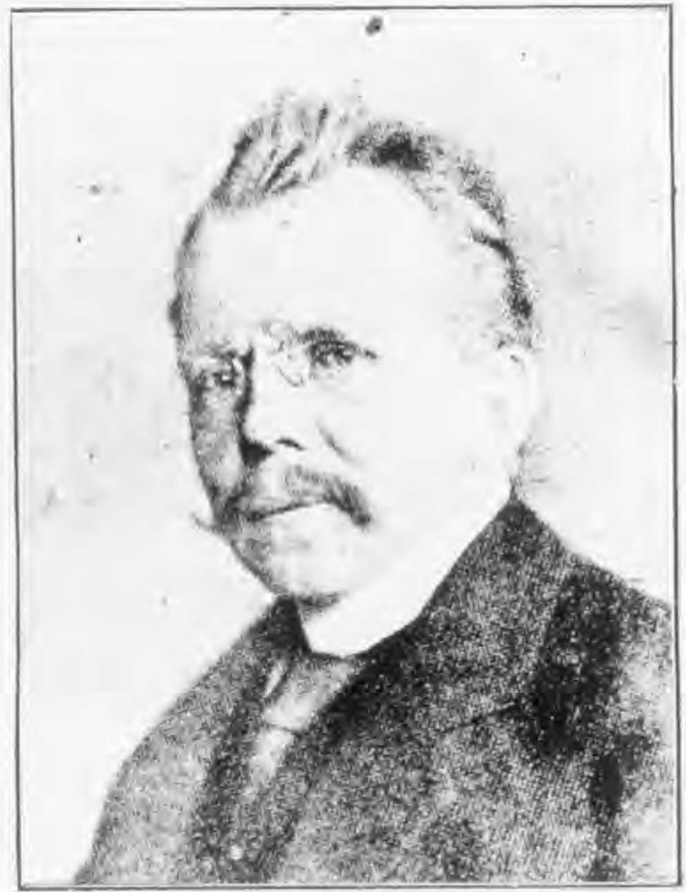
文化主義教育家 斯普蘭格 (Edward Spranger)