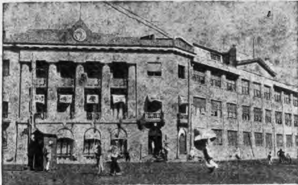
屋廠廠分平北館本