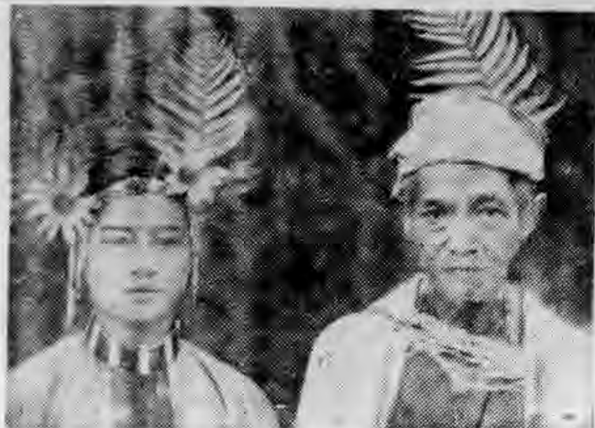
女孫與父祖的族山高

的限制，隔絕了同外人的來往機會，所以生活各方面，直到今日仍保持着不少特殊的生活方式與習慣。