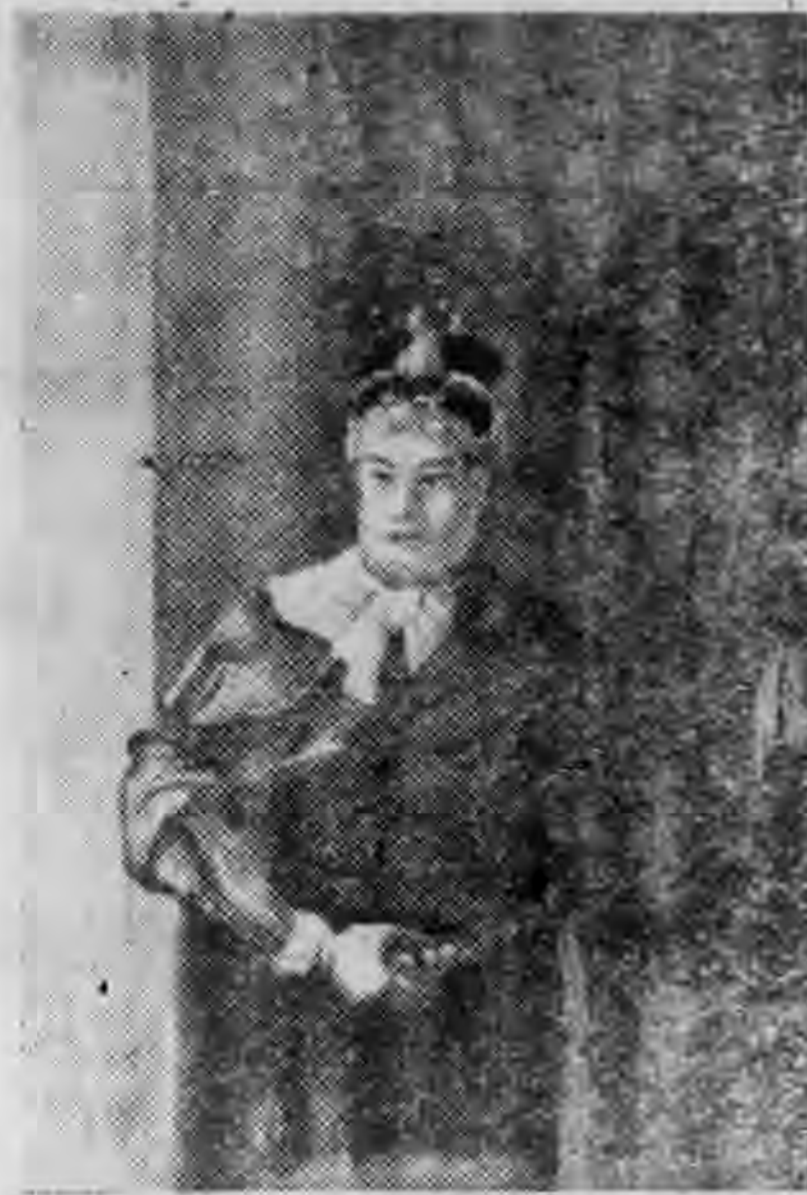
功成鄭主山開灣台

成功身後，子經繼，在位二十年，病歿，經子克塽繼位，年幼無能，兩年後（康熙二十二年），投降滿清，台灣遂正式歸入中國版圖。先是設府置縣附屬福建，從此閩粵同胞入台謀生者與時俱增。台灣地位亦因此日見重要，光緒十二年（一八八七年）即正式改為行省。