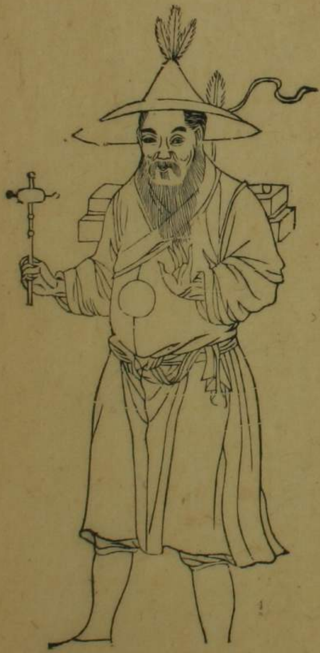
西藏巴呼喀木等處番人