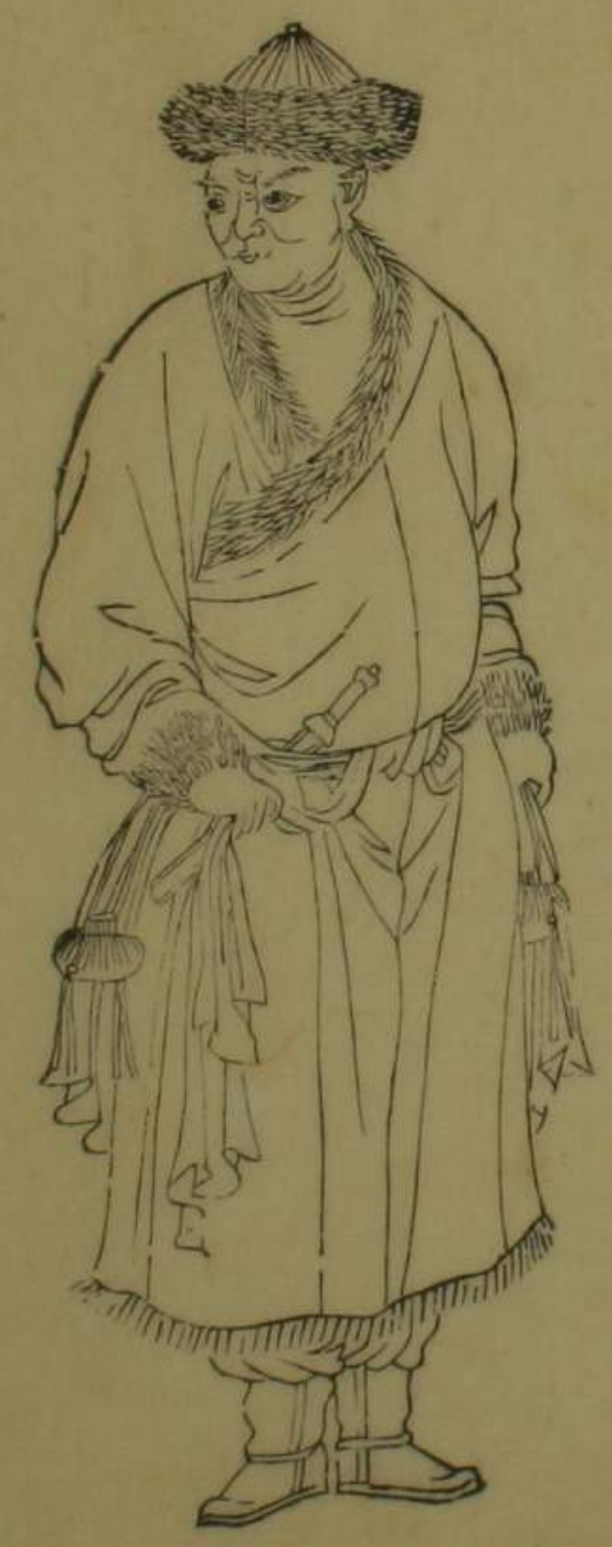
肅州金塔寺魯克察克等族回民