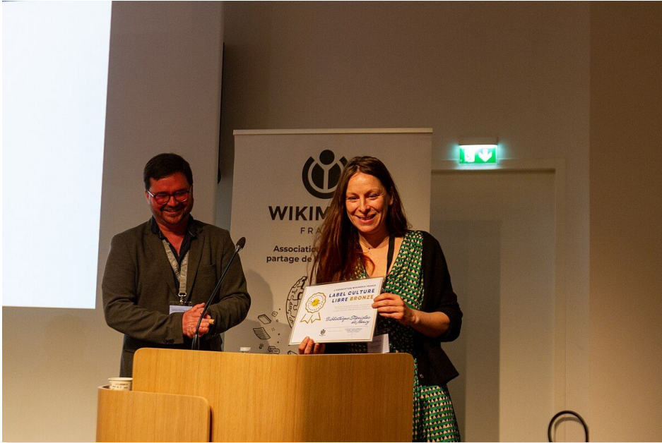
Michael Barbereau WMFr, CC BY-SA 4.0, via Wikimedia Commons