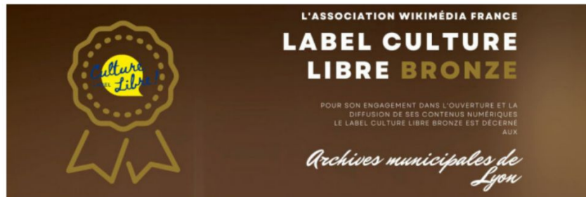
Diplôme du label Culture libre pour les AML

Le 25 avril 2023, les AML ont obtenu le 1er niveau du label Culture Libre proposé par Wikimédia France , qui est une charte d'engagement pour l'accessibilité, l'ouverture et la diffusion de contenus libres par les institutions culturelles. Elles font partie des 16 premières institutions labellisées à la journée Culture et Numérique de Wikimédia France . La bibliothèque municipale de Lyon a également été labellisée ainsi que, pour les services d'archives, les Archives nationales et les Archives municipales de Nancy . Vous pouvez consulter le rapport de Wikimédia France et de l'agence Phare sur L'open content dans les institutions culturelles en France (2022), qui dresse un état des lieux des pratiques numériques et d'ouverture des contenus.