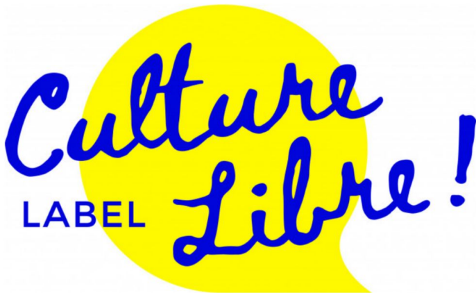
Logo du label Culture libre 1er niveau

Dois-je demander l'autorisation et payer des redevances de réutilisation ?