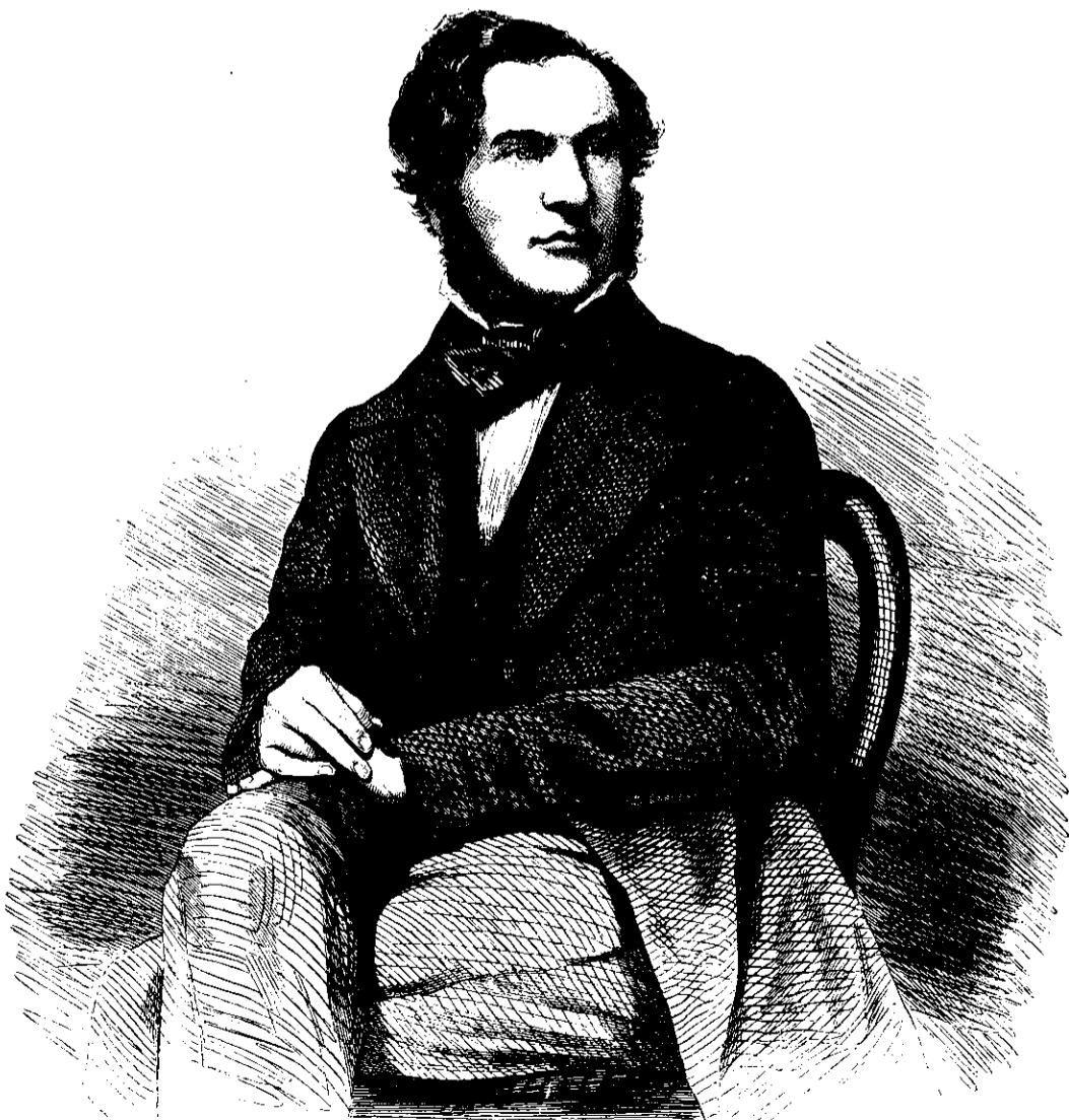
William Ewart Gladstone, storbritanisk Finanzminister.

For det under Valgkampen i Newark lidte Nederlag skulde Gladstone dog snart faae en glimrende Oprejsning, idet Universitetet i Oxford ved de almindelige Valg i 1847 valgte ham til sin Repræsentant, en Ære som i Almindelighed kun Statsmand af første Rang, s. Ex. Canning og Peel, havde nydt. I Forening med Sir Robert Peel optraadte han nu som Leder for det liberal-conservative Parti i Underhuset; han bekæmpede Papismen, men stemte til stor Forargelse for sine Vælgere for Isøernes Udgang til Parlamentet. Da han ogsaa erklærede sig for det af Protectionisternes Anfører, Disraeli indbragte Forslag, der gik ud paa at undersøge den agerdyrkende Befolknings Tilstand og træffe Forholdsregler til at afhjælpe den iblandt den herskende Nød, begyndte dette Parti at nærme sig om at kunne vinde ham og gjorde ham flere Tilbud, da det i Aaret 1851 prøvede paa at danne et Cabinet. Men Gladstone havde ingenlunde opgivet sine politiske Grundfætninger, saaledes som Torierne troede; han havde