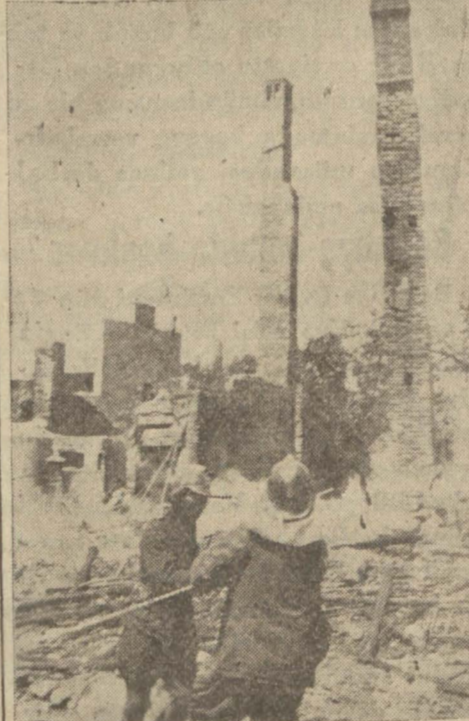
İtfaiye yangın yerindeki bacaları yıkıyor

Yangından çıkanlardan 15 aile Raifağa camiine, 5 aile Kâmil Bey apartmanına, 10 aile Teşvikiye Askerlik şubesinin boş olan binasına, bir aile Münir Beyin boş hanesine, bir (Mabadi 4 üncü sahifede)