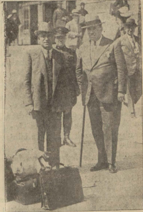
Dün şehrimize gelmiş olan Millî Müdafaa ve Adliye Vekilleri Haydarpaşa'da

Millî Müdafaa Vekili Zekâi ve Adliye Vekili Yusuf Kemal Beyler dün öğleyn posta trenile Ankara'dan şehrimize gelmişlerdir. Ankara treni yarım saat ka-