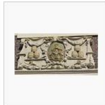
Detail met botertonnen boven een deur aan de Prinsegracht