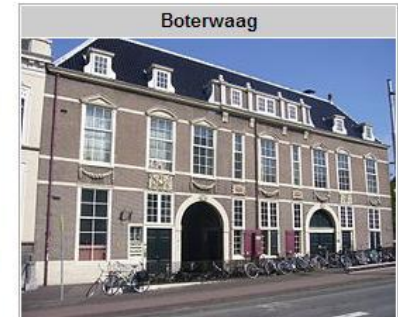
Boterhuis en Boterwaag