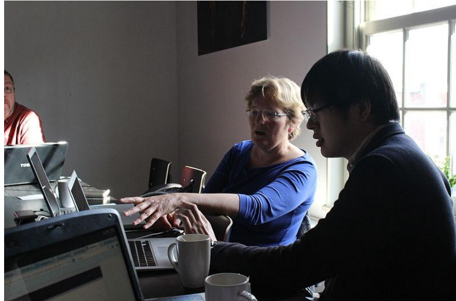
Wikipedians at work, Photo: Vera de Kok

In the Japanese Wikipedia, nothing mentions the Boterwaag, and there isn't even an article yet on "Weigh house", though there is a category available for buildings in The Hague.