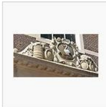
Bouwjaar 1681, detail met botertonnen boven de entree aan de Grote Markt.