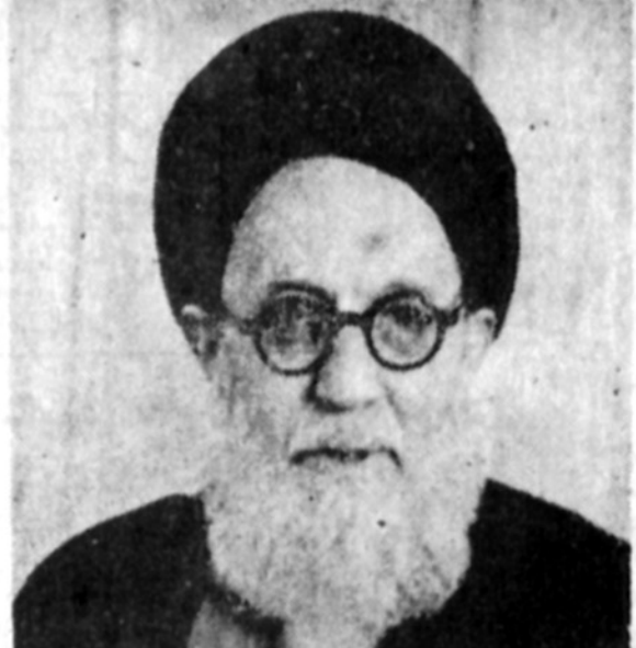
آیت الله شریعتمداری

تندرو خواننده ششم اسما وقتی در اروپا یک بطری خواهد بود و سعی میشود برای یک بطری نفت عادلانه اوپک ایجاد شود.