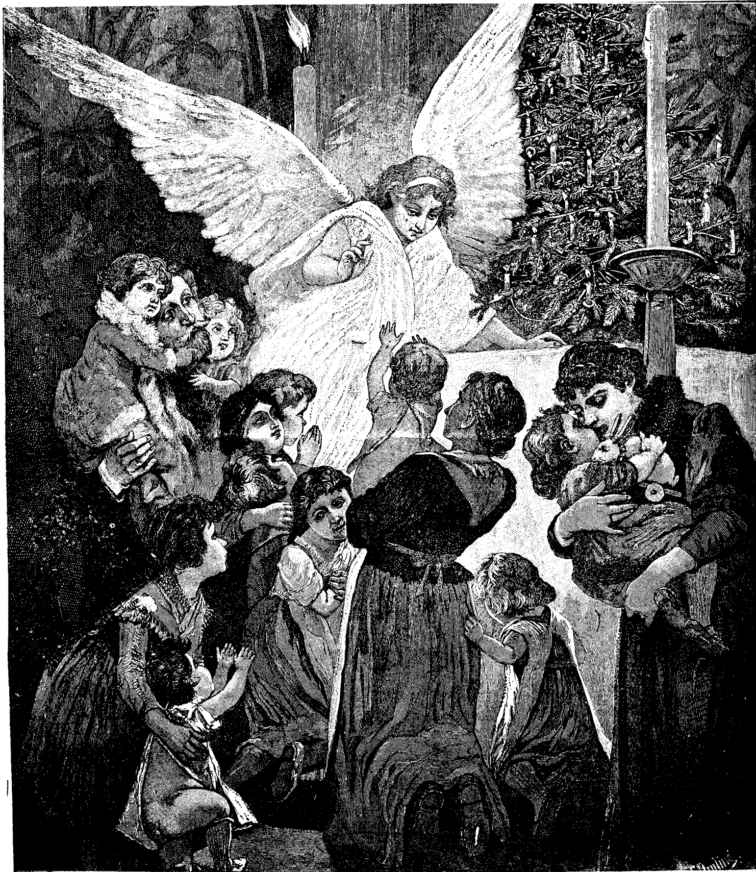
Ingerul s'a pogorit.