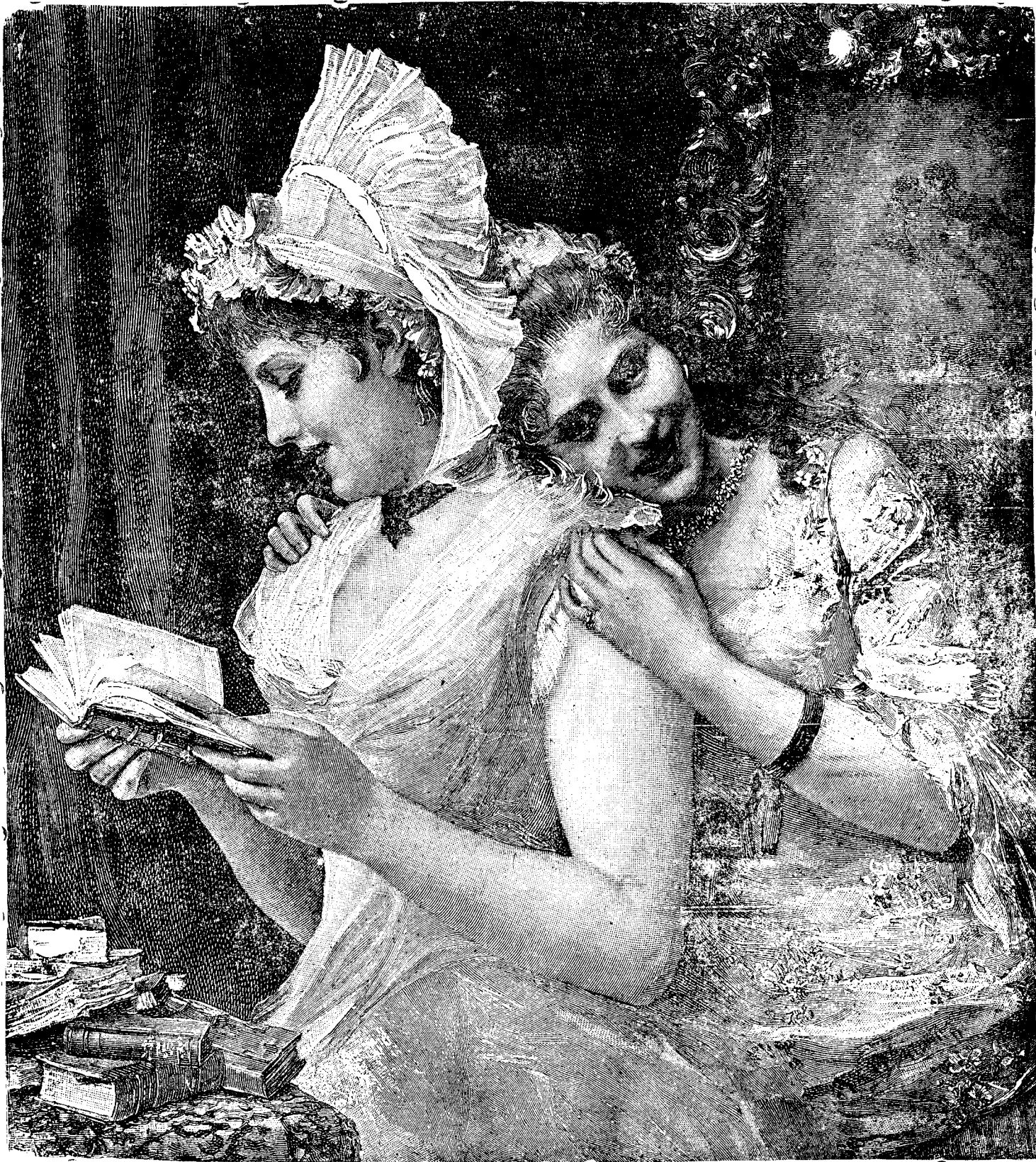
O carte interesantă.

cum ni se părea atât de dulce: Copii, la culcare! După ce se stingea lampa, me întorceam cu fața către Aurel și-l priveam în tăcere, prin întune-